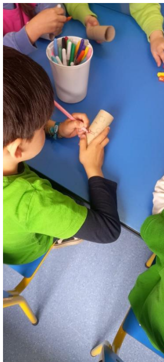
Figura 22- Início da pintura do projetor