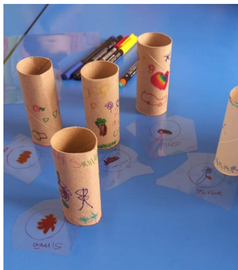
Figura 23- Projetores e projeções quase prontas