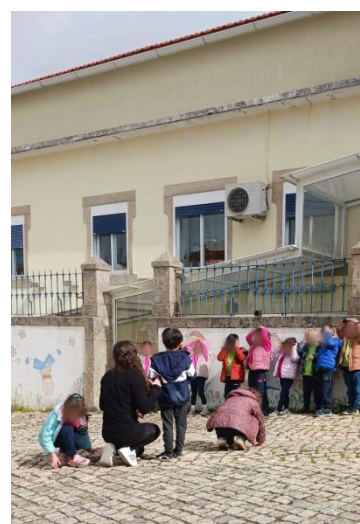
Figura 9- O mestre mandou colocar uma só mão na cabeça