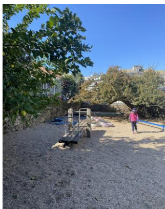
Figura 3 - Parque da Areia

Ao lado da entrada principal do centro infantil também existe um parque composto por uma estrutura fixa com escorrega e o chão adaptado para o conforto e segurança das crianças.