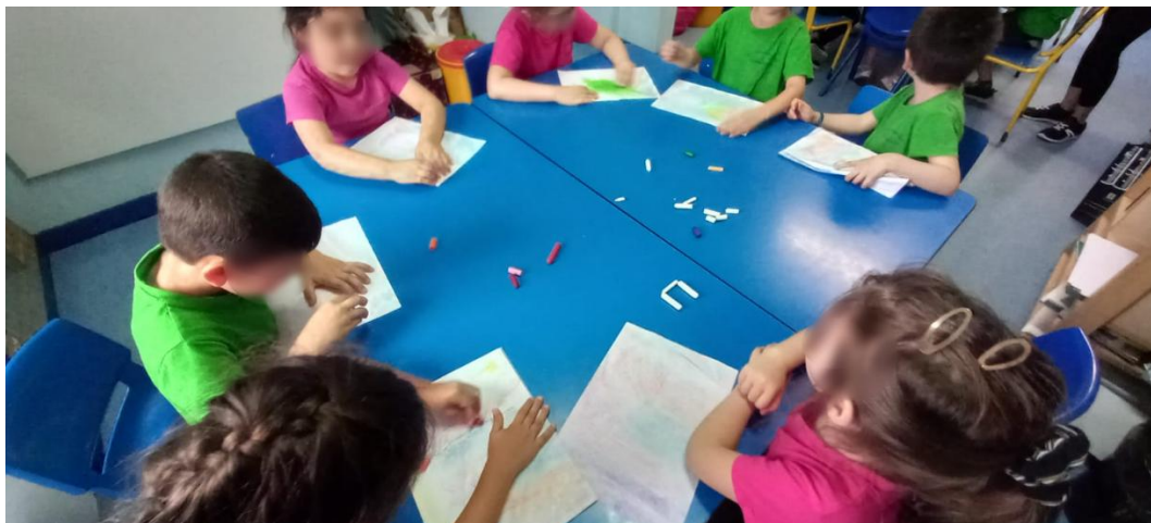
Figura 18- Criação dos desenhos mágicos