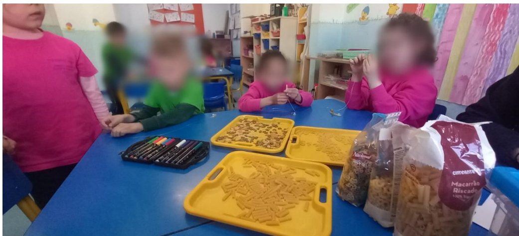
Figura 12- Início da atividade onde irão inserir as massas no fio