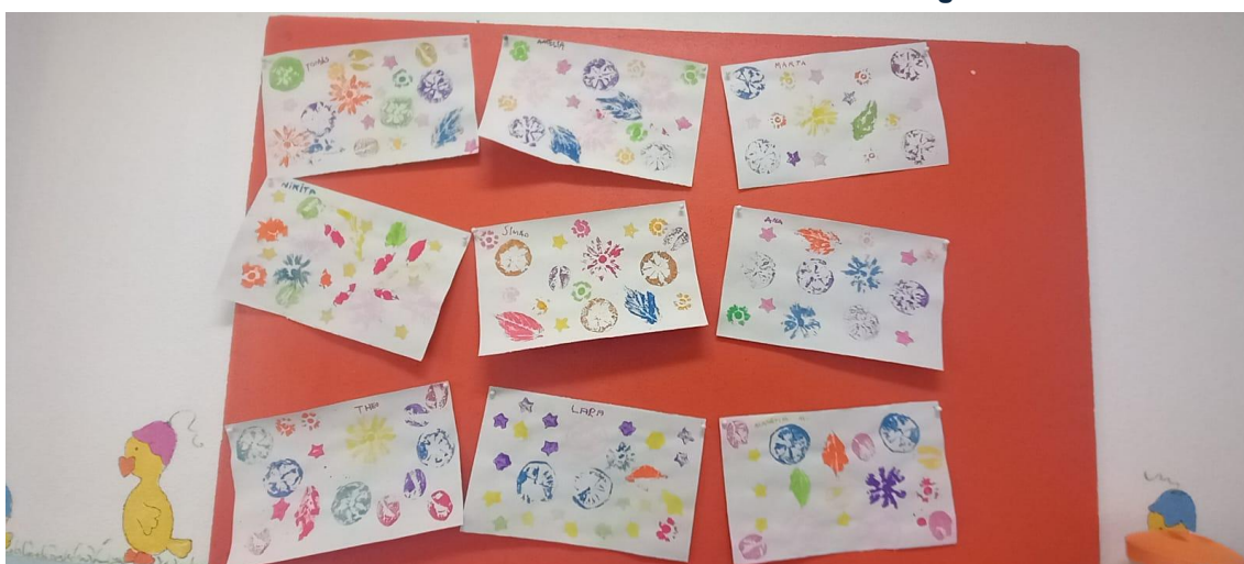
Figura 30- Atividade acabada e exposta na sala para todos verem