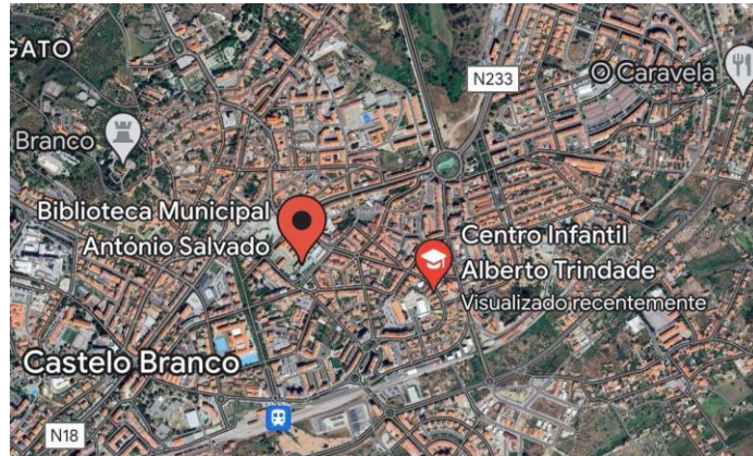
Figura 1- Localização do Centro Infantil Alberto Trindade no Mapa

O Centro Infantil Alberto Trindade atende crianças das faixas etárias entre os 6 meses e os 6 anos de idade e encontra-se localizado no Bairro da Horta D'Alva, na Rua Engenheiro Frederico Ulrich, nomeada em homenagem ao antigo Ministro das Obras Públicas. A área inclui um Pólo do Centro de Apoio a