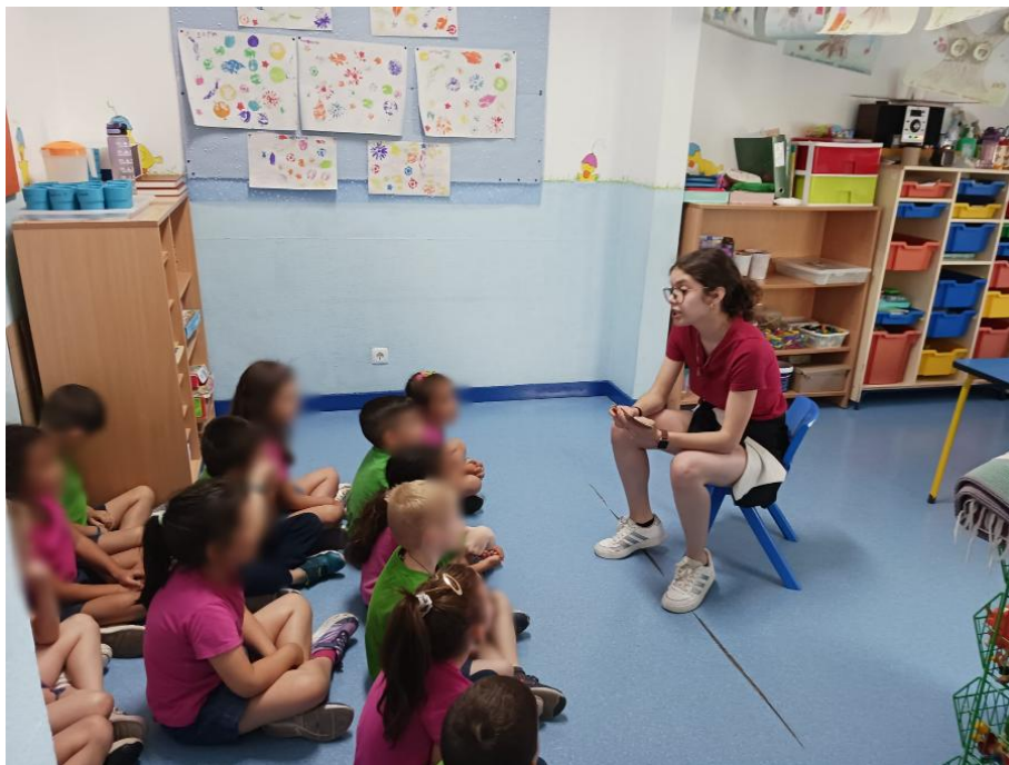
Figura 10- Explicação da atividade