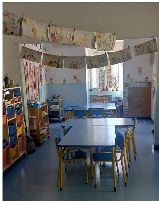
Figura 5- Imagem da Sala Patinho Feio

Esta sala dispõe de mobiliário funcional e seguro e de um espaço para exposição dos trabalhos das crianças. Alguns recursos e materiais já apresentam algum desgaste. A sala possui uma casa de banho com três sanitas e três lavatórios.