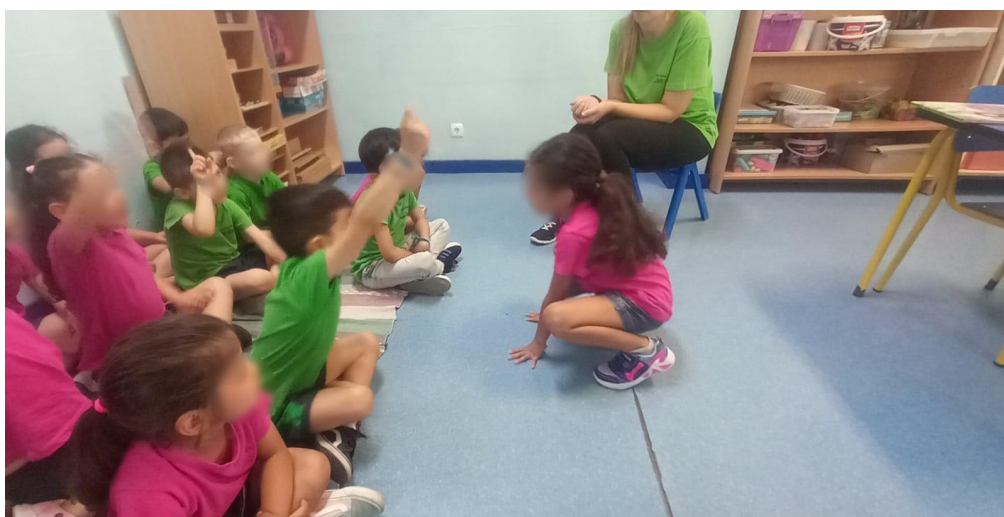
Figura 21 - As crianças estavam a tentar adivinhar que animal era a amiga