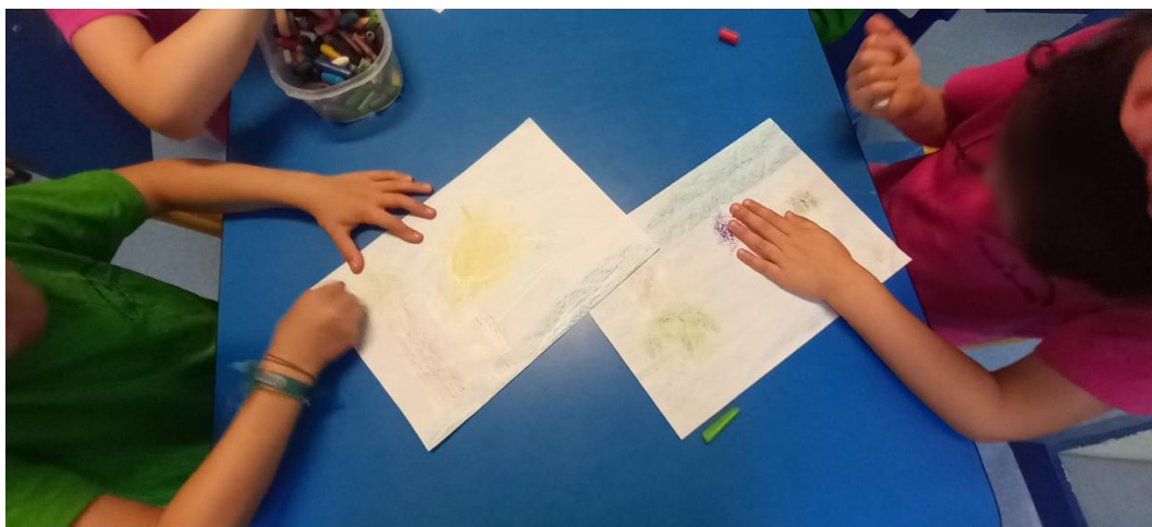
Figura 19 - Desenhos já quase prontos