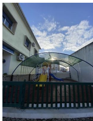
Figura 4 - Parque da Entrada