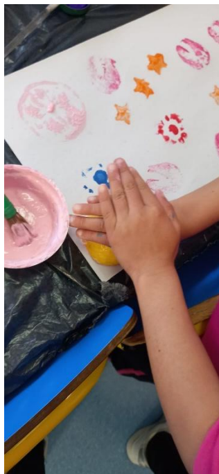
Figura 28- Aqui a criança está a usar um limão como carimbo