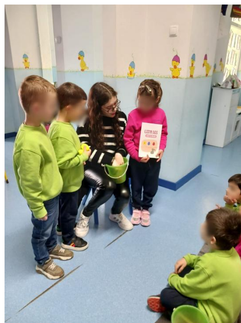
Figura 17- Outro grupo a fazer a contagem para descobrirmos quem ganhou.