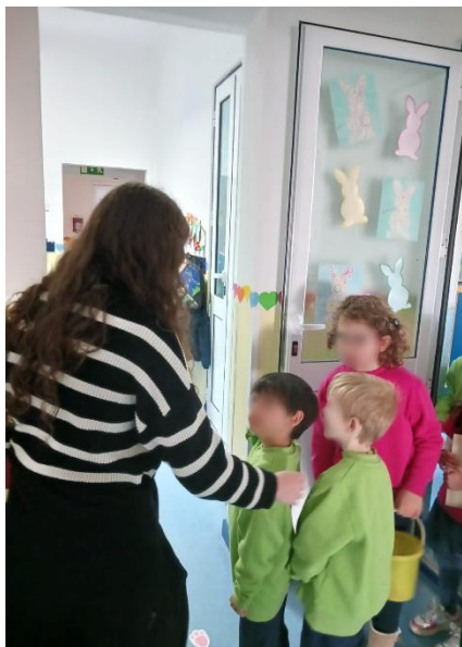
Figura 14- Início da caça aos Ovos