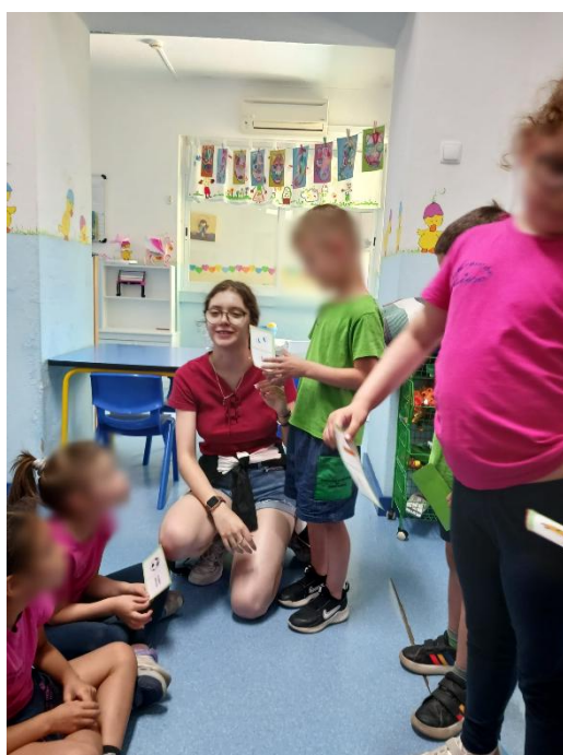
Figura 11- Nesta imagem a criança estava a formar, a frase e a colocar a palavra encontrada nela