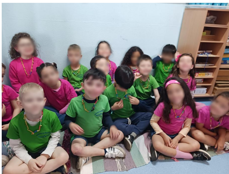
Figura 13- Fotografia em grupo com os colares