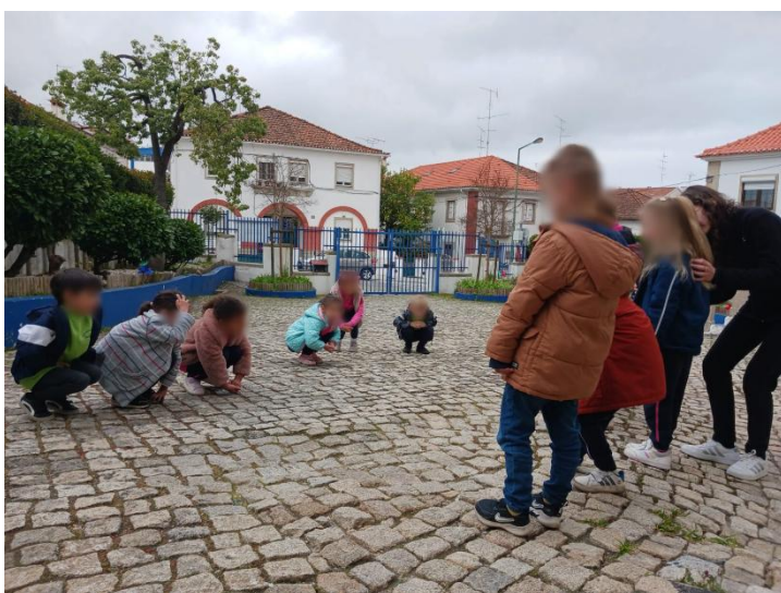
Figura 8- O mestre mudou e mandou tocar, nos pés