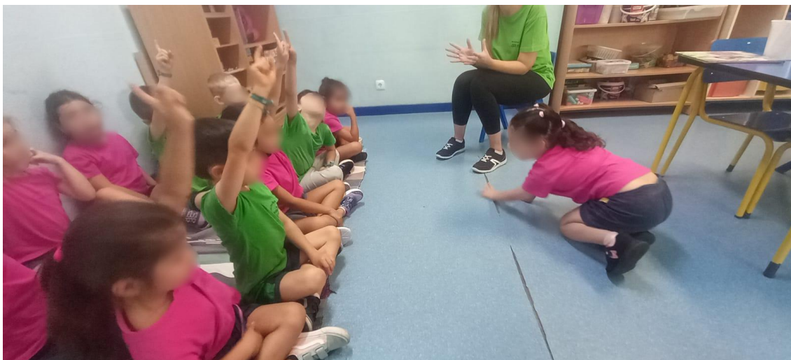
Figura 20 – Início da atividade a minha palavra mágica vão desvendar através da mimica.