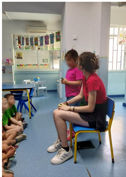
Figura 25- Eu gosto de salvar vidas, quem sou eu?