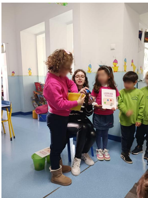
Figura 16 - Contagem dos ovos de um dos grupos