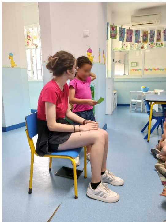
Figura 26- Aqui a criança está a dizer que adora flores, qual será a sua profissão?