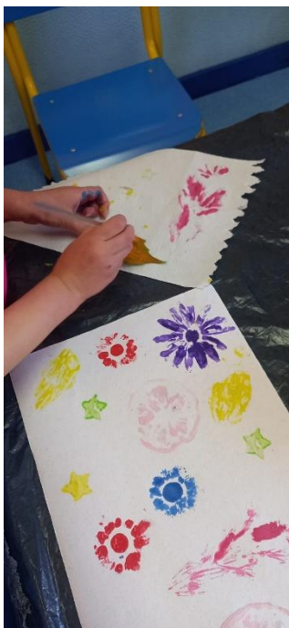
Figura 27- Nesta imagem a criança está a retirar a folha para ver se pintou