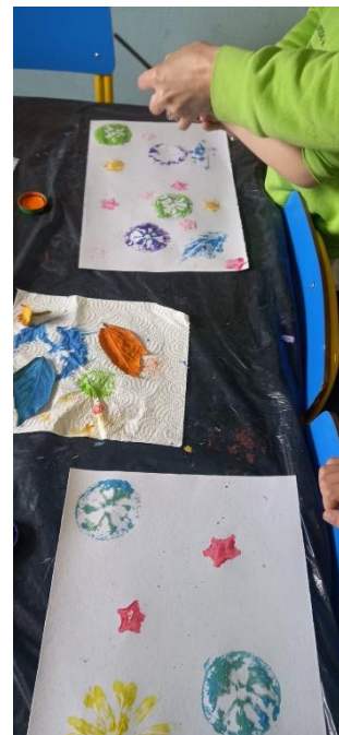
Figura 29- A criança está a pintar o limão e o outro amigo está a pensar em que elemento e que cor usar agora