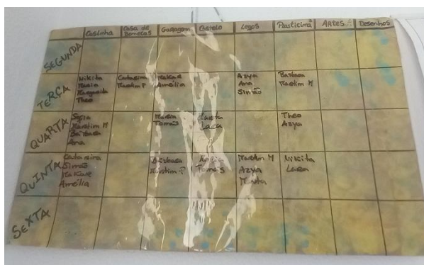
Figura 6 - Painel dos Cantinhos

Na sala do Patinho Feio, há um painel interativo que incentiva as crianças a escolherem a área onde desejam brincar, promovendo sua autonomia e o desenvolvimento da capacidade de tomar decisões. As crianças estão cientes de que, caso tenham escolhido um espaço nos dias anteriores, devem explorar novos cantinhos, garantindo uma distribuição equilibrada entre as diferentes áreas disponíveis. O sistema está organizado de maneira clara, permitindo que as crianças compreendam quantas podem estar em cada espaço ao mesmo tempo. Isso fortalece o respeito pelas regras e contribui para uma utilização harmoniosa do ambiente.