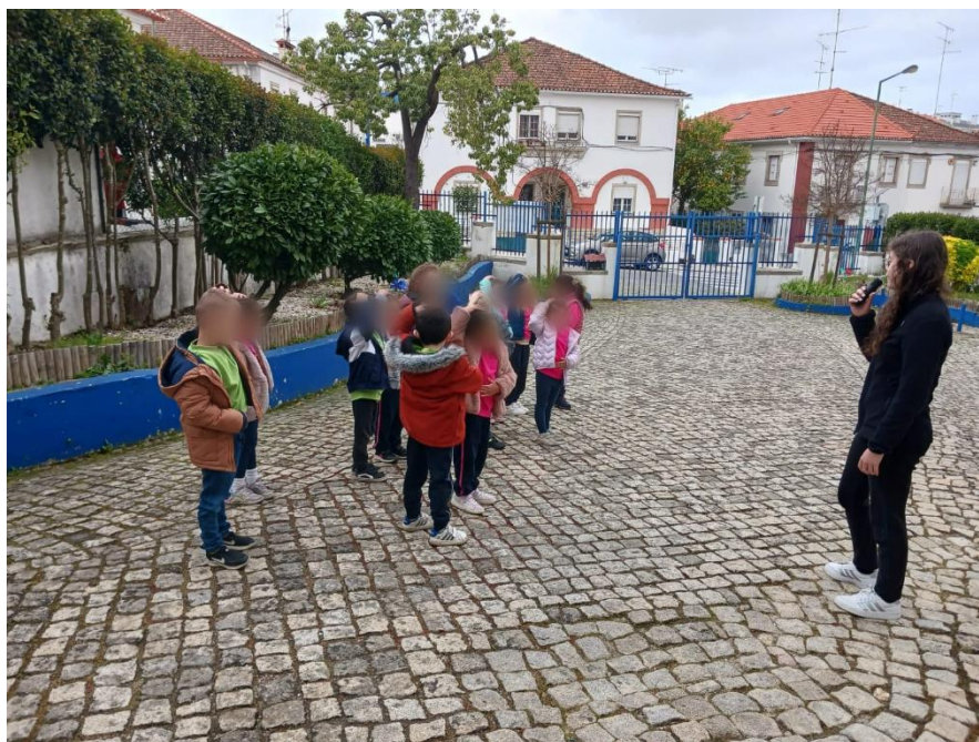
Figura 7- Nesta imagem o mestre tinha mandado colocar a mão na cabeça