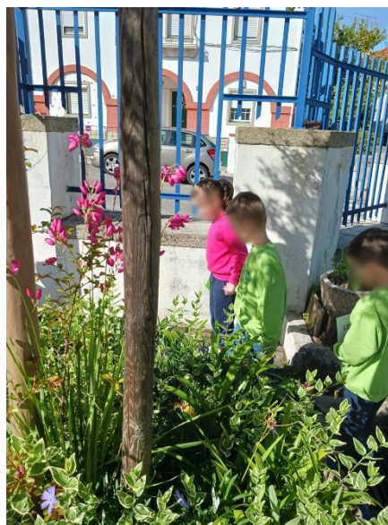
Figura 15 - Há procura dos ovos que estão na lista