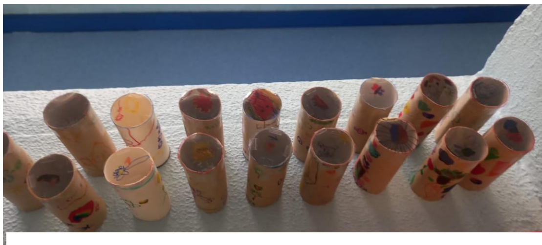
Figura 24- Projetores prontos