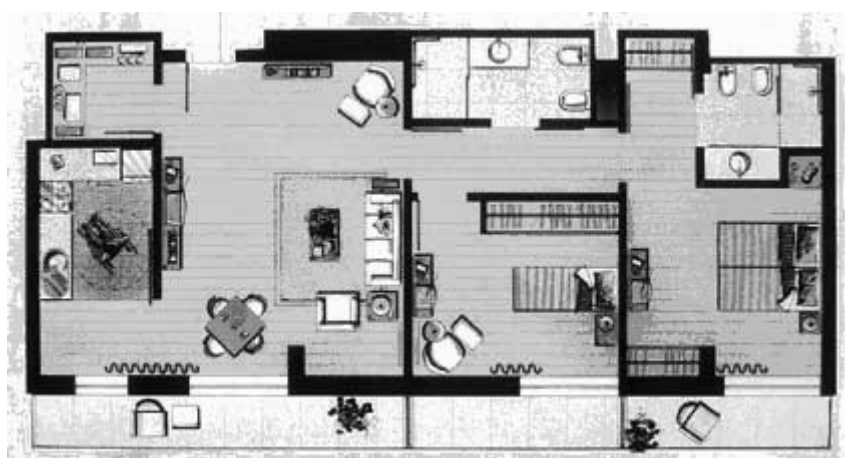
Figura 9 - Condomínio Residencial Domus Clube. Planta tipologia T2