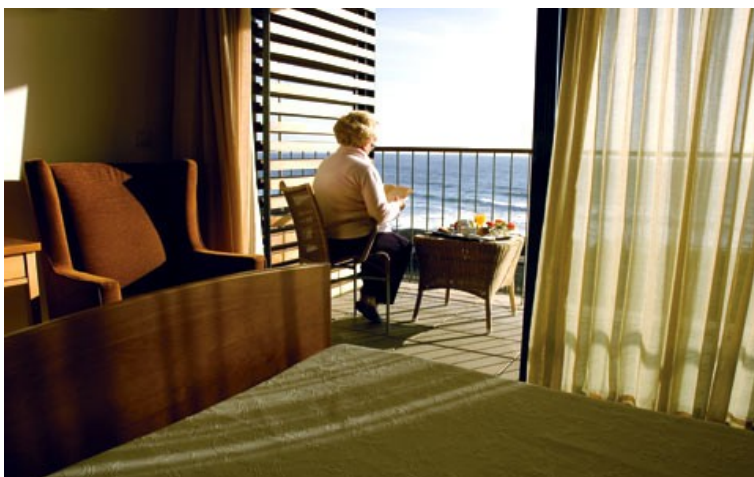
Figura 6 - Exemplo de um quarto para idosos. Residência Domus Pallium.