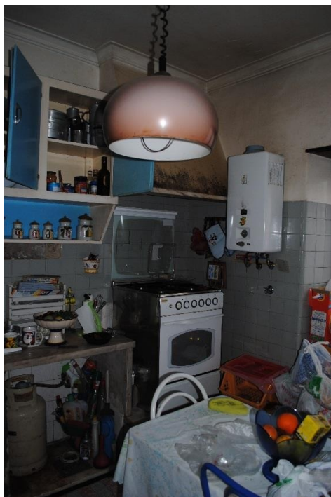
Figura 10 - Cozinha da habitação antes da intervenção.

Através da visita ao espaço em questão, foi possível visualizar o estado em que o mesmo se encontrava, principalmente em relação aos revestimentos e iluminação, percebendo que o espaço, em geral, encontrava-se com problemas de humidade nas paredes da cozinha e casa de banho devido a infiltrações.