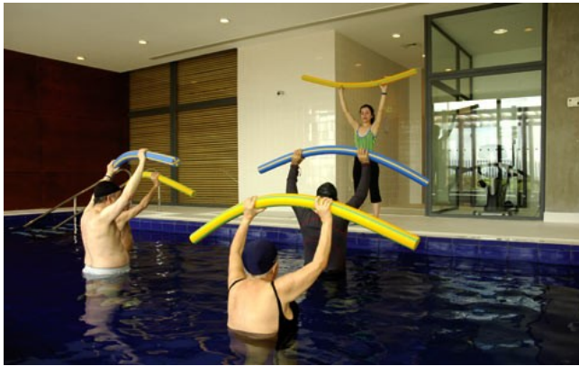
Figura 4 - Atividade para promover o envelhecimento ativo