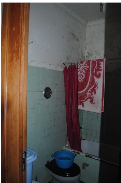
Figura 11 - WC antes da intervenção.