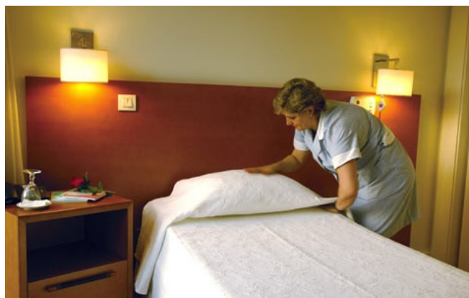
Figura 7 - Quarto Residência Domus Pallium, pormenor iluminação de leitura.