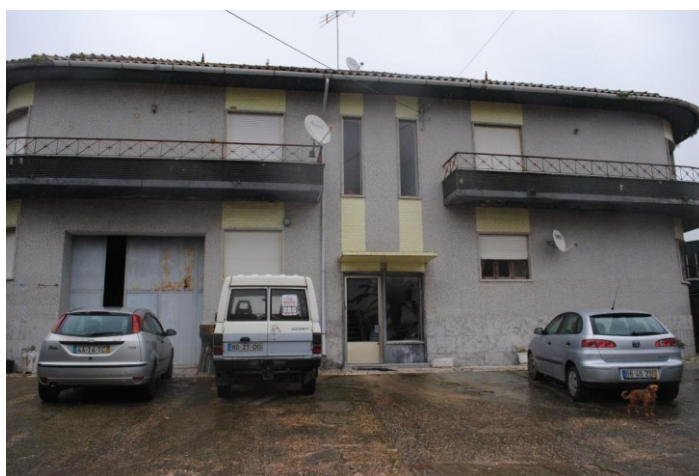
Figura 2 - Prédio onde se localiza a habitação, vista frontal.

A habitação localiza-se num prédio, o qual pertence exclusivamente a um proprietário (neste caso o cliente). O edifício é constituído por três apartamentos, sendo que o projeto será desenvolvido no rés-do-chão.