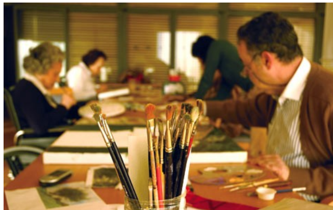
Figura 5 - Atividade que estimula a capacidade de concentração