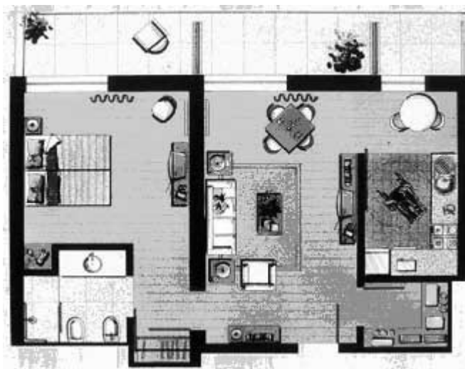
Figura 8 - Condomínio Residencial Domus Clube. Planta Tipologia T1.