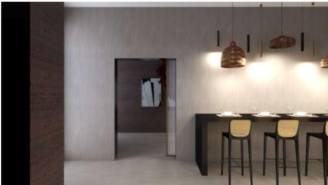
Figura 2 – Render de zona de refeições. Fonte Própria.

Este, um restaurante com uma decoração moderna e acolhedora, caracterizada por uma paleta de cores escuras e pormenores vibrantes. Os principais elementos observados são: