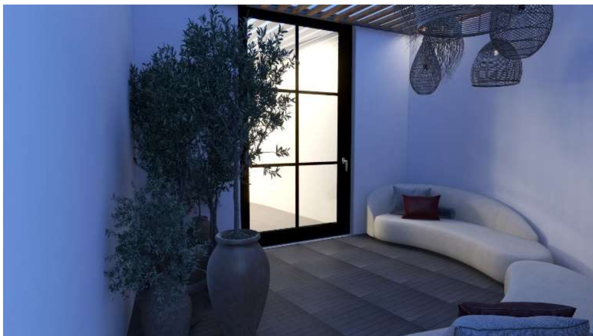
Figura 1 - Render de zona exterior.

A necessidade de atender às demandas do crescimento do turismo na cidade, motivou a decisão de realizar uma remodelação completa neste edifício. Neste, foram intervencionados todos os pisos, criando uma zona de refeições e uma zona de instalações sanitárias no piso 0, e nos restantes pisos (piso 1 e 2), criados 3 quartos suites por piso, conseguindo numa hipotética lotação máxima, capacidade para 12 hóspedes. Além disto, o piso 1 está munido de uma pequena zona exterior, onde os hóspedes podem descansar e usufruir de um bom livro. ´