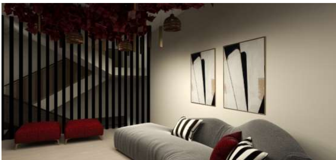
Figura 4 - Render da zona de estar.

Subindo as escadas, deparamo-nos com uma zona de estar. Esta tem um conjunto de puffs e um sofá, de design contemporâneo e coberto com um tecido cinza-claro, que está posicionado contra a parede, decorado com almofadas listradas em preto e branco, além de algumas almofadas vermelhas, proporcionando um contraste de cores interessante. Separando o espaço de estar de outra área de circulação, as escadas, há um ripado vertical preto, que cria uma divisão visual interessante sem bloquear completamente a visão, através do qual é possível ver as escadas e outras partes do interior.