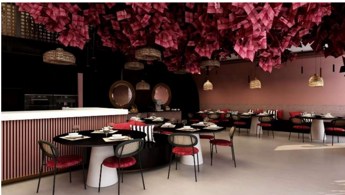
Figura 3 - Render do bistrôt.

Subindo as escadas, deparamo-nos com uma zona de estar. Esta tem um conjunto de puffs e um sofá, de design contemporâneo e coberto com um tecido cinza-claro, que está posicionado contra a parede, decorado com almofadas listradas em preto e branco, além de algumas almofadas vermelhas, proporcionando um contraste de cores interessante. Separando o espaço de estar de outra área de circulação, as escadas, há um ripado vertical preto, que cria uma divisão visual interessante sem bloquear completamente a visão, através do qual é possível ver as escadas e outras partes do interior.