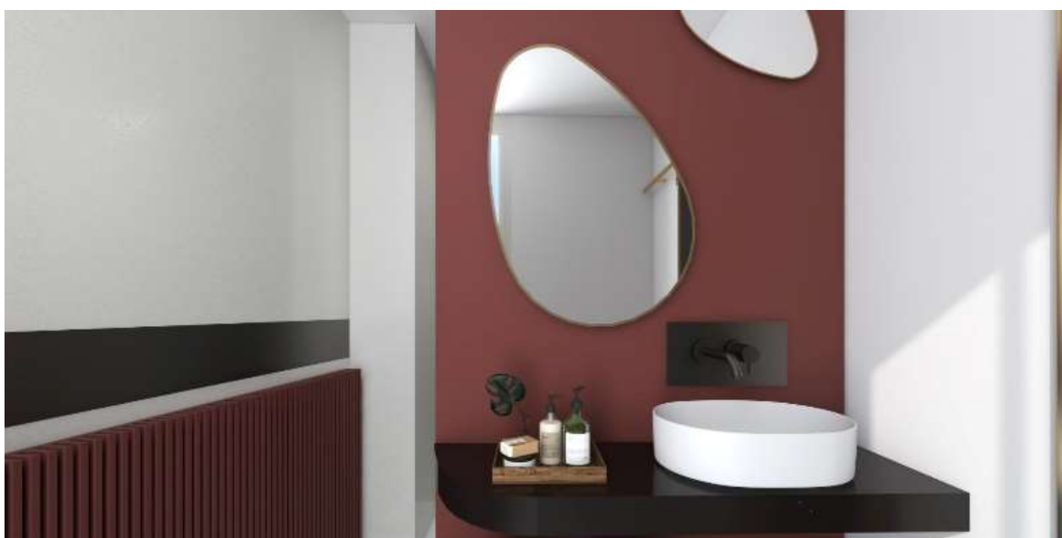
Figura 7 - Render da casa de banho. Fonte Própria.

Além destes elementos, as casas de banho estão munidas por uma cabine de duche e uma sanita. A cabine, coberta a vidro, com um duche em inox preto e a sanita de porcelana branca.