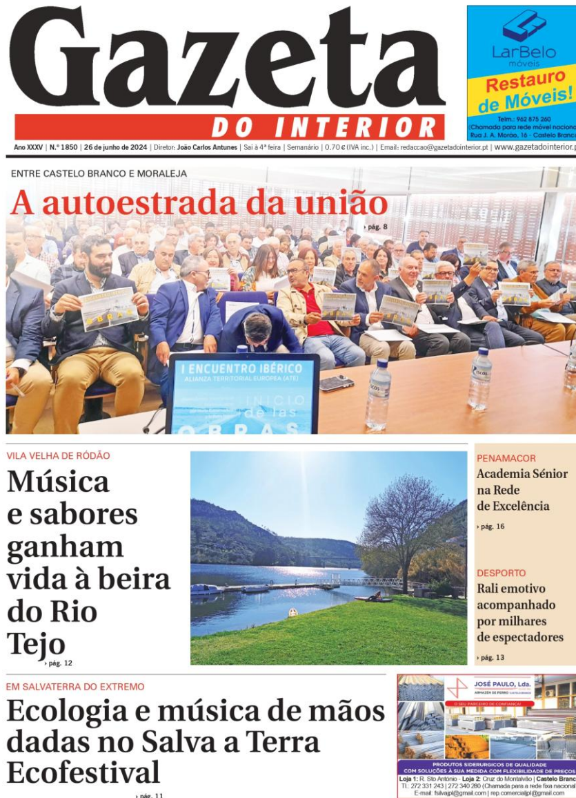
Figura 2 – capa do jornal