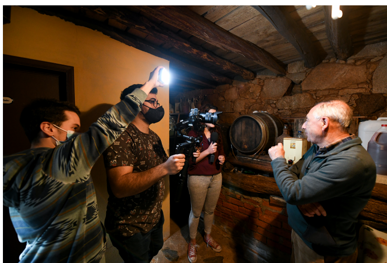
Figura 24 - Exemplo de reportagem.

Após as gravações, houve uma equipa de duas pessoas que estiveram durante três dias na parte da edição, em que as reportagens continham cerca de 2/3 minutos, com uma música de fundo e o entrevistado a falar um pouco sobre o seu comércio local. Quando finalizaram a edição das reportagens, houve uma revisão por parte do assistente de realização para verificar se estava tudo conforme planeado, desde os oráculos, a introdução e a transição final para a emissão em direto, em baixo fica uma imagem de exemplo de uma reportagem semelhante (nos mesmos moldes) mas de uma outra transmissão de um programa.