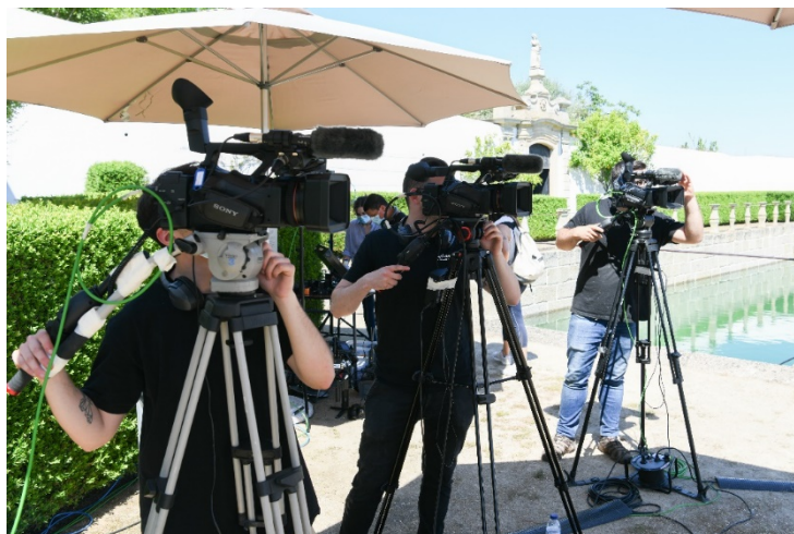
Figura 15 - Testes de imagem com os operadores de câmara fixa

Resumidamente, a seguir à montagem técnica das câmaras fazem-se os primeiros testes de imagem, onde se trabalha o melhor posicionamento das câmaras, o tipo de planos que cada uma irá fazer, se está tudo bem com o material, desde os cabos SDI e HDMI (que ligam as câmaras ao carro de exteriores/régie móvel), como podemos observar no exemplo em baixo.