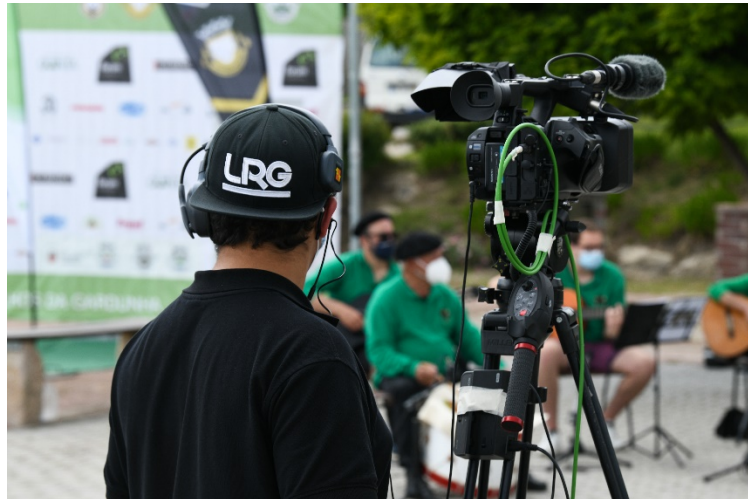
Figura 25 - Operador de Câmara Fixa

De seguida foi feito outro contacto com o Presidente da Junta de Freguesia em que a equipa técnica solicitou alguns adereços para um cenário mais envolvente (neste caso seria a natureza), como se pode verificar pelo exemplo foi colocado um outdoor com a marca do Louriçal (que era utilizado na prova de UTG e que é uma marca de referência já da freguesia).