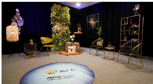
Figura 4 - Plano mais aproximado do “set” das entrevistas.