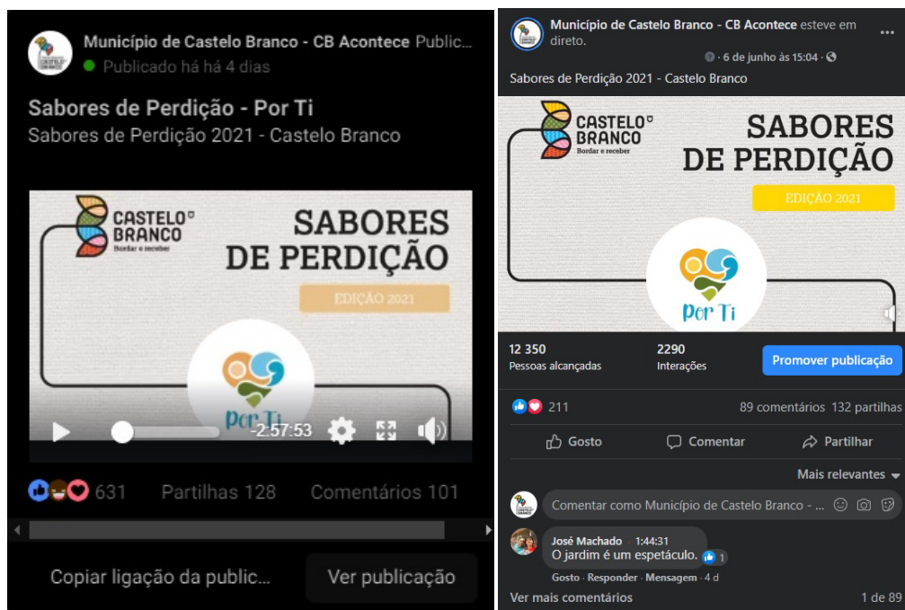
Figura 21 - Estatísticas do programa.

Como se trata de um programa transmitido pela internet, neste caso pela rede social facebook, a interação com o público é importante e fica demonstrado com a publicação e com o número de pessoas alcançadas e interações, como podemos ver nos seguinte exemplos, na imagem à esquerda temos o número total de reações, partilhas e comentários. Na imagem à direita temos o número de pessoas alcançadas (12.350) e interações (2290), o que é um número bastante positivo.