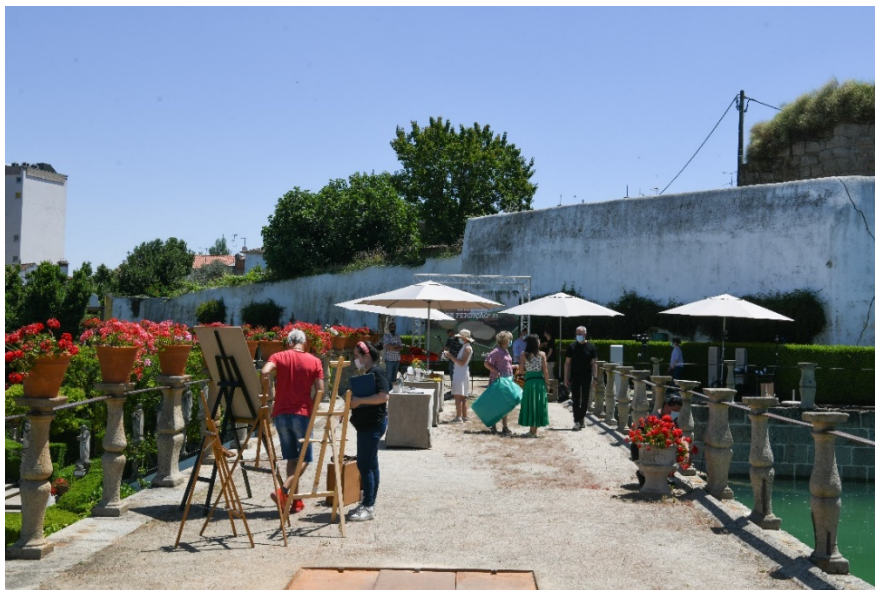
Figura 20 - Espaço onde decorreu o programa “Sabores de Perdição 2021”