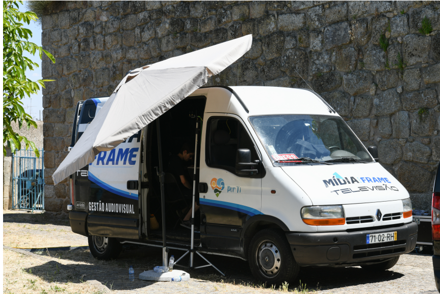
Figura 19 - Carro de exteriores