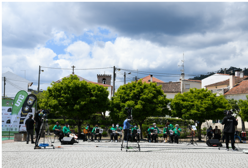
Figura 23- Espaço geral onde decorreu o programa.

Após as gravações, houve uma equipa de duas pessoas que estiveram durante três dias na parte da edição, em que as reportagens continham cerca de 2/3 minutos, com uma música de fundo e o entrevistado a falar um pouco sobre o seu comércio local. Quando finalizaram a edição das reportagens, houve uma revisão por parte do assistente de realização para verificar se estava tudo conforme planeado, desde os oráculos, a introdução e a transição final para a emissão em direto, em baixo fica uma imagem de exemplo de uma reportagem semelhante (nos mesmos moldes) mas de uma outra transmissão de um programa.