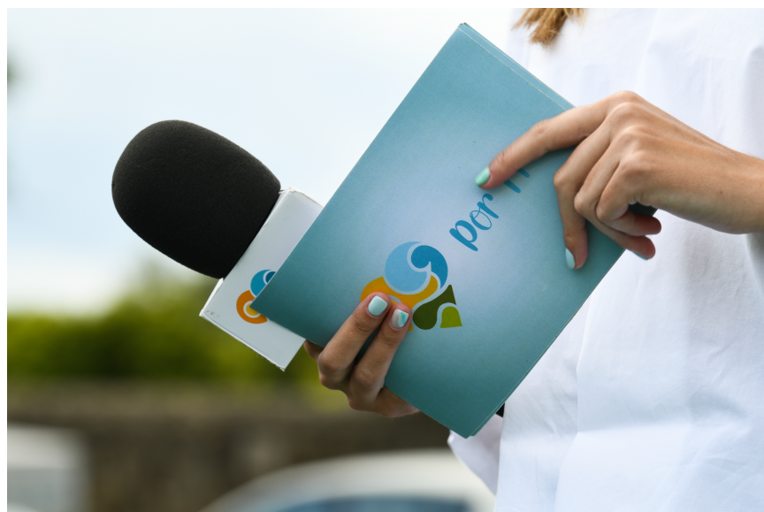
Figura 18 - Cartão dos apresentadores

O assistente de realização fica no meio do realizador e operador de grafismos, pois é quem tem o guião e consegue controlar toda a realização, e, intervir sempre que seja necessário, até mesmo se falhar algo e seja preciso um plano B. É esta pessoa que dá a ordem para alteração (esta pessoa tanto pode falar com os apresentadores como também tem sempre hipótese de falar com os operadores de câmara). Por exemplo quando está a passar uma reportagem é ele quem dá indicações de quanto tempo falta para entrarmos no ar outra vez, como exemplo dos cartões dos apresentadores a imagem de seguida.