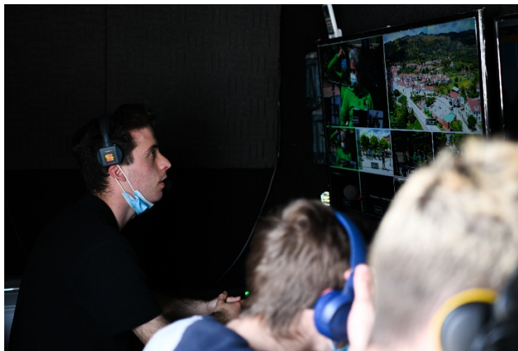
Figura 7 - Carro de exteriores (interior), realização.