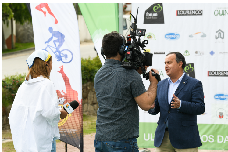
Figura 26 - Exemplo de Entrevista.

Foram feitos vários contatos com as pessoas que iriam estar presentes para estarem informados das horas que tinham de estar no local da transmissão para se fazer os devidos ajustes técnicos e pormenores finais, essas pessoas ficavam sentadas por ordem de entrada nas cadeiras (que não se vê na emissão), em seguida fica um exemplo de uma dessas entrevistas em direto.