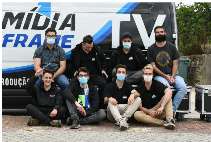
Figura 27 - Equipa de Produção.

A duração deste programa foi cerca de 02H00, e no final da emissão houve cerca de 10 mil pessoas alcançadas, o que foi bastante positivo para o alcance geral da população, em seguida fica uma imagem de alguns elementos da equipa de produção.