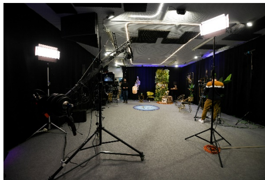
Figura 3 -Uma vista mais geral do estúdio, com o “set” onde se realizam as entrevistas aos convidados do programa.