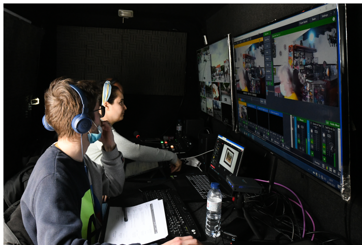
Figura 6 - Carro de exteriores (interior).

Nos seguintes exemplos temos o carro de exteriores (interior) de forma a explicar o que mencionei em cima e como tudo se procede.