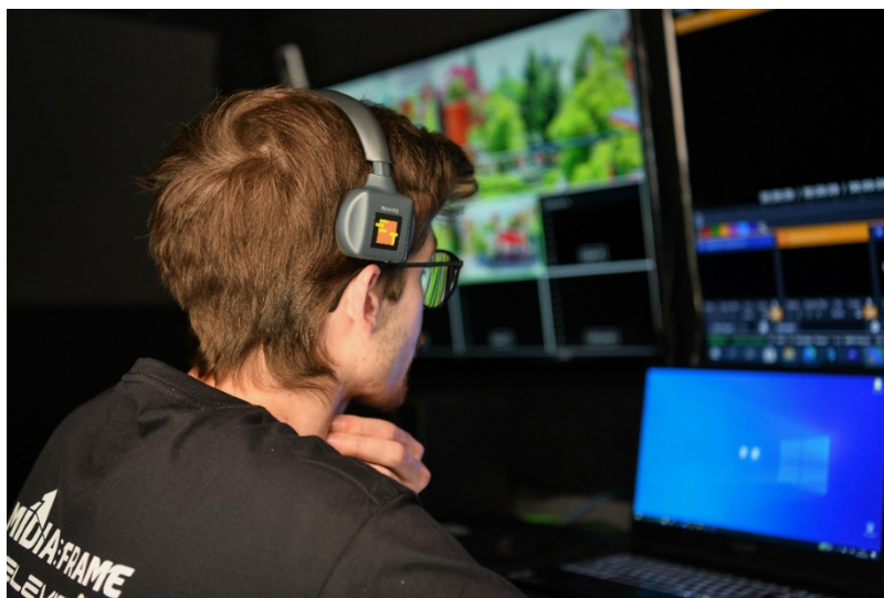
Figura 17 - Operador de grafismos antes da emissão começar com eartec's.

Antes da emissão há sempre uma breve reunião entre o assistente de realização e o operador de grafismos, para verificarem todas as reportagens e grafismos que irão sair durante a emissão e verificarem os últimos pormenores ou dúvidas que possam existir. É importante referir que o operador de grafismos é o único membro que não tem comunicação para fora a não ser dentro do carro de exteriores, pois não faz sentido tal coisa e só cria confusão para quem está a operar câmaras. A comunicação com os operadores de câmara é feita por eartec's (sistema de comunicação por wireless), o que possibilita que a partir do carro de exterior e num raio de 400 metros não haja falha nenhuma de comunicação. Atualmente dispomos até 7 equipamentos para utilização (em simultâneo) que também podem ser utilizados separados (4 ao mesmo tempo).