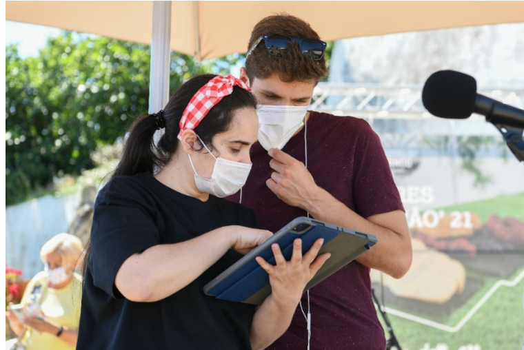
Figura 16 - Assistente de Realização com Apresentador.

Antes da emissão há sempre uma breve reunião entre o assistente de realização e o operador de grafismos, para verificarem todas as reportagens e grafismos que irão sair durante a emissão e verificarem os últimos pormenores ou dúvidas que possam existir. É importante referir que o operador de grafismos é o único membro que não tem comunicação para fora a não ser dentro do carro de exteriores, pois não faz sentido tal coisa e só cria confusão para quem está a operar câmaras. A comunicação com os operadores de câmara é feita por eartec's (sistema de comunicação por wireless), o que possibilita que a partir do carro de exterior e num raio de 400 metros não haja falha nenhuma de comunicação. Atualmente dispomos até 7 equipamentos para utilização (em simultâneo) que também podem ser utilizados separados (4 ao mesmo tempo).