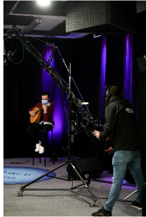
Figura 2 - O operador de grua em movimentos “teste” do programa, na parte do cenário musical.