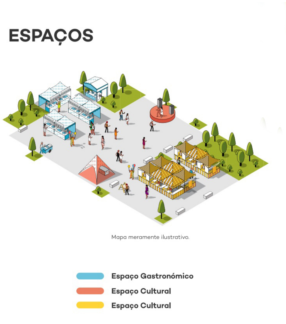
Figura 9 - Esquema da localização do programa.

Aqui mostramos uma imagem com uma maquete onde se exemplifica o espaço atrás descrito: