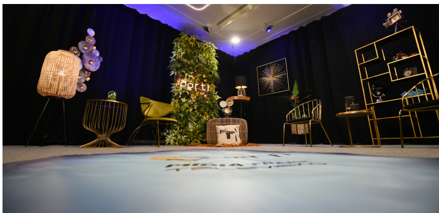
Figura 5 - Estúdio de Televisão “Mídia Frame”

Na imagem em baixo deixo um exemplo de cenário do programa “Por ti” nos estúdios da Mídia Frame Televisão.