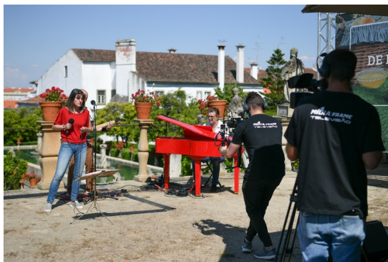
Figura 10 - Grupo “Cavaquinho Show in Trio” - Momento musical.

A transmissão começou com o grupo “Cavaquinho Show in Trio” com a música “Beirã - Rui Veloso” e logo em seguida a intervenção do Presidente do Município de Castelo Branco (que foi gravada previamente).