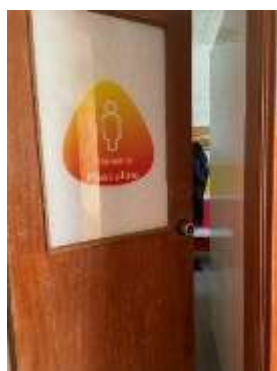
FIGURA 11- BALNEÁRIO MASCULINO