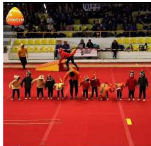
FIGURA 22-CLASSE KANONI

Segue-se uma fotografia de cada classe na competição.