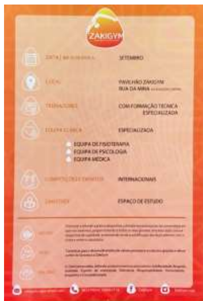
FIGURA 17- FLYER DE TRÁS