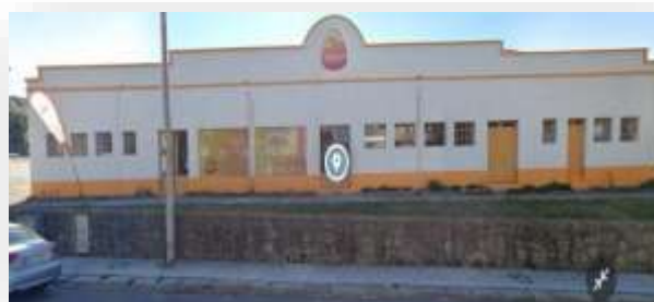
FIGURA 1 - LOCAL DA INSTITUIÇÃO

Na época 2020/2021, a ZakiGym mudou-se para um espaço próprio, o que representou um grande avanço para a Associação. Essa mudança permitiu um aumento no número de ginastas e nas horas de treino, melhorando as condições oferecidas. Anteriormente, os treinos eram realizados no pavilhão da Escola Superior de Educação.