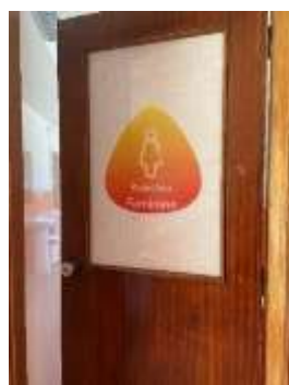
FIGURA 12- BALNEÁRIO FEMININO