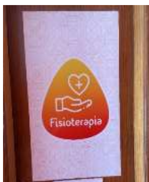
FIGURA 10- SALA DE FISIOTERAPIA