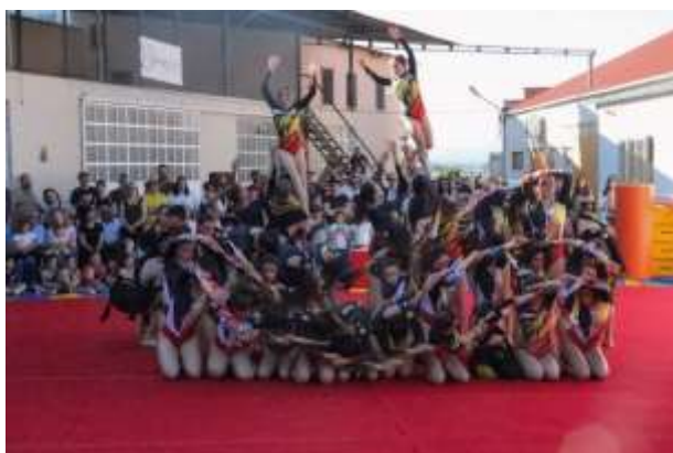
FIGURA 37- UMA DAS DEMOSTRAÇÕES