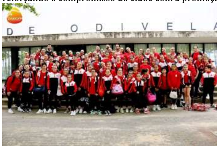
FIGURA 33-ATLETAS DO 1º DIA

Nos dias 25 e 27 de abril, a ZakiGym marcou presença no evento Gym For Life Portugal, realizado em Odivelas. No dia 25 de abril, o clube apresentou as turmas Shaka e Nubdak, demonstrando o talento e a dedicação dos seus alunos. No dia 27 de abril, foi a vez das turmas Zuri e Ayan subirem ao palco, continuando a mostrar a excelência do trabalho desenvolvido pela ZakiGym. A participação no evento foi uma oportunidade valiosa para os ginastas exibirem as suas habilidades e coreografias, reforçando o compromisso do clube com a promoção da ginástica de qualidade.