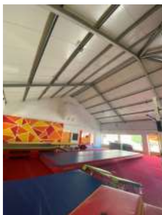
FIGURA 5- ESPAÇO 1