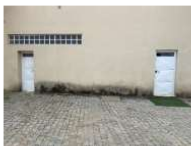
FIGURA 13- 2 SALAS DO EXTERIOR