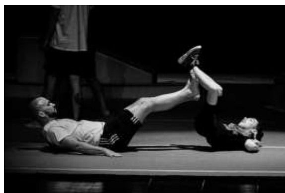
FIGURA 40 - FOTOGRAFIA DO ESPETÁCULO