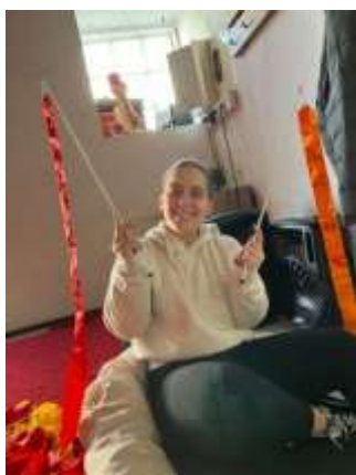
FIGURA 43 -DOBRAR FITAS

Durante o período de estágio, foi-me proposto elaborar o teste in body na balança Bioimpedância para os atletas da classe Núbia. Além disso, conforme mencionado anteriormente no ponto 5.1.1, fui incumbido de desenvolver uma atividade específica. Também prestei auxílio na organização dos materiais necessários e na arrumação dos mesmos, contribuindo assim para a eficiência e a ordem do ambiente de trabalho.