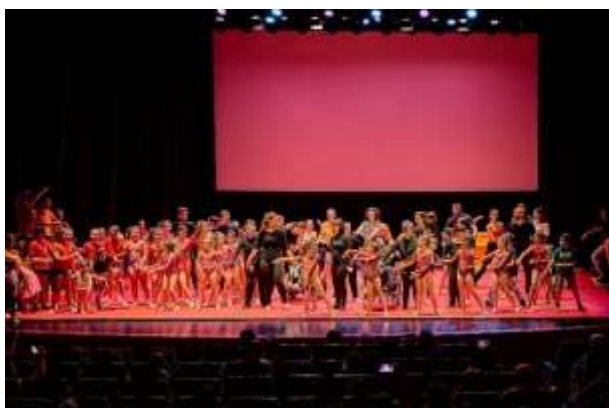
FIGURA 39- FOTOGRAFIA DO ESPETÁCULO

A Erid - Educar, Reabilitar, Incluir Diferenças organizou uma demonstração de ginástica no Cine-Teatro de Castelo Branco, com a ZakiGym como uma das suas parceiras. A ZakiGym apresentou-se com 4 classes: Zulu, Endag, Shaka e Akin. O evento destacou-se pela empatia e pela partilha de valores entre os clubes, evidenciando o espírito de união sugerido pelo nome do evento. A contribuição de todos os participantes foi fundamental para que esta demonstração se tornasse verdadeiramente inesquecível.