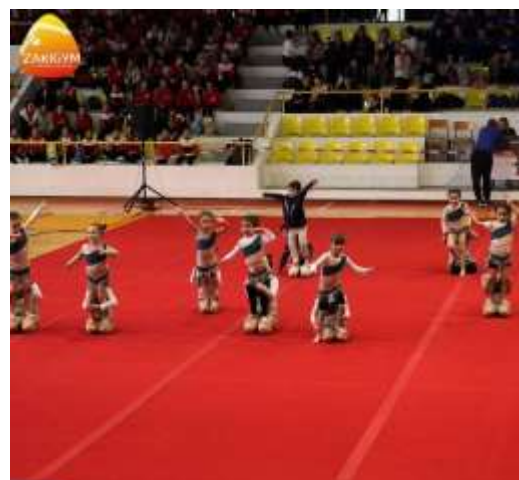
FIGURA 23- CLASSE ZAKININOS