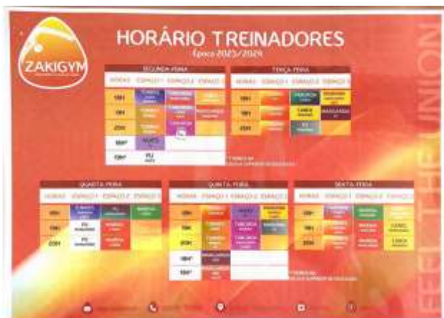
FIGURA 4 - RESPONSÁVEIS PELOS TREINOS