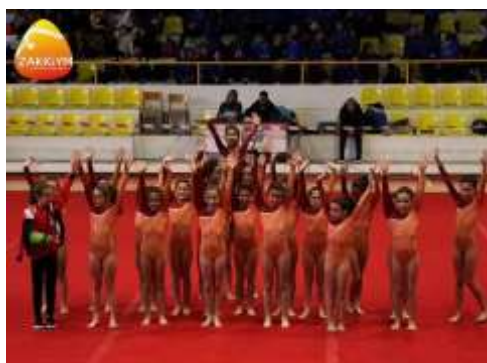
FIGURA 28- CLASSE AYAN