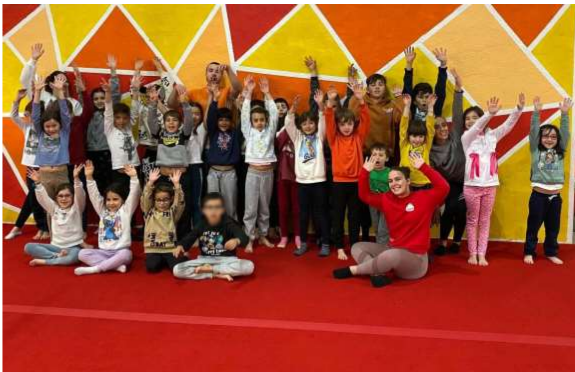
FIGURA 42 - ATIVIDADES DE TEMPO LIVRE(ATL) E DE EDUCAÇÃO INFANTIL

Durante o período de estágio, tive a valiosa oportunidade de ministrar aulas de Atividades de Tempo Livre (ATL) e de Educação Infantil. Esta experiência foi particularmente significativa para mim, pois nunca havia tido a chance de atuar nessas áreas. Essa oportunidade permitiu-me desenvolver habilidades pedagógicas específicas e aprimorar meu entendimento das necessidades e dinâmicas educacionais dos diferentes grupos etários envolvidos.