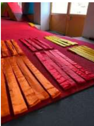
FIGURA 44- FITAS DE ACORDO COM AS CORES