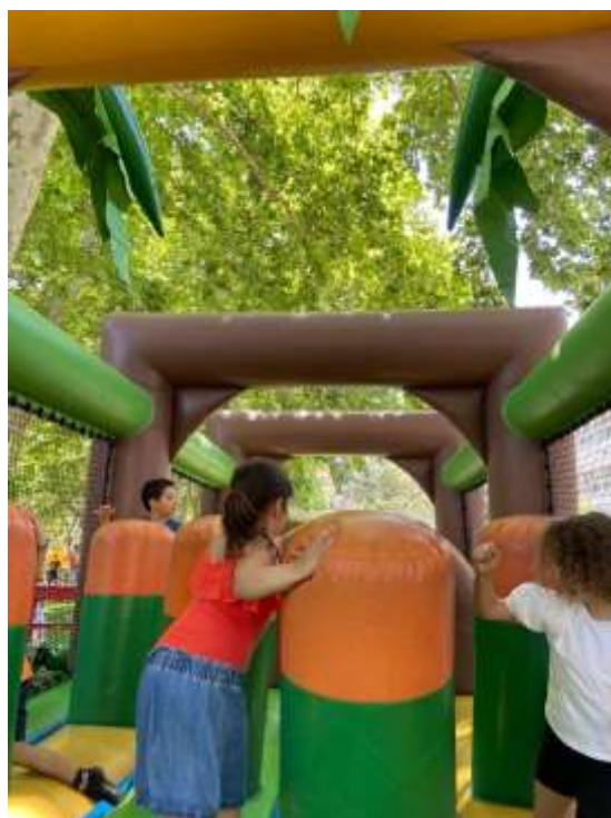
FIGURA 41- COMEMORAÇÃO DO DIA DA CRIANÇA

A ZakiGym marcou presença no evento organizado pelo Clube Setubalense em celebração do Dia Mundial da Criança. Durante esta ocasião especial, a ZakiGym desempenhou um papel fundamental ao colaborar ativamente na organização e execução das atividades. O seu contributo foi essencial para proporcionar um dia inesquecível, repleto de alegria e diversão para todas as crianças participantes. A dedicação e empenho da ZakiGym ajudaram a criar um ambiente festivo, promovendo momentos de pura felicidade e entretenimento para os mais pequenos.