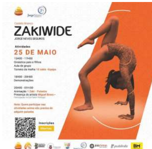
FIGURA 36 - CARTAZ DE DIVULGAÇÃO

Aqui está o cartaz utilizado e algumas fotografias do evento.