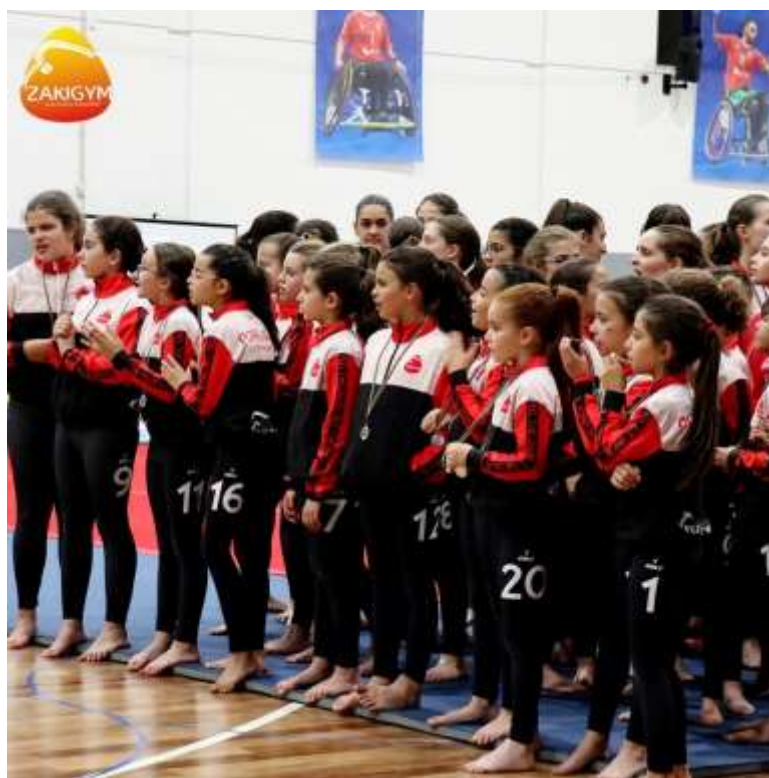
FIGURA 35-CAMPEONATO TERRITORIAL DA AGDCENTRO

Nesta competição ficamos bem representados pois ficamos de todas as equipas em 1º lugar e algumas em 2º lugar.