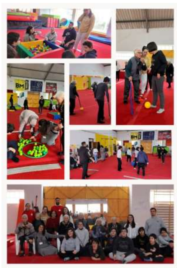
FIGURA 19- FOTOGRAFIA DA ATIVIDADE

Antes da realização do evento, dedicámos grande cuidado à seleção dos jogos, garantindo que fossem divertidos e adequados para ambas as instituições. No dia do evento, pusemos em prática o que havíamos planeado, e tudo correu conforme o esperado, resultando na satisfação e apreciação das instituições pelo nosso trabalho.