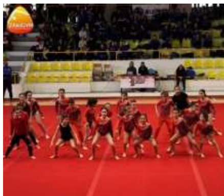
FIGURA 25- CLASSE ZULU