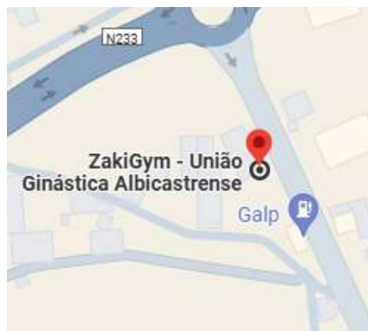
FIGURA 2 -LOCALIZAÇÃO EXATA DA INSTITUIÇÃO

O seu horário de funcionamento é de Segunda a Sexta, abre às 15h:30m da tarde e encerra às 21h:30m da noite. O encerramento da instituição é ao sábado e domingo, porém maioritariamente das vezes os ginastas têm competições e demonstrações. É uma instituição onde existe respeito pelas diferentes características, objetivos e personalidade de cada um, tendo várias atividades com entidades diferentes como Associação Portuguesa de Pais e Amigos do Cidadão Deficiente Mental (APPACDM), Associação Educar, Reabilitar e Incluir Diferenças (ERID) e Wamba Jovem Associação Juvenil De Vila Velha De Ródão Associações culturais e recreativas.