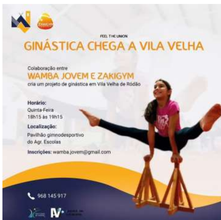
FIGURA 20-CARTAZ DE DIVULGAÇÃO

Durante os treinos, os participantes têm a oportunidade de aprender diversos elementos da ginástica, tanto em modalidades individuais quanto em conjunto. O objetivo maior é preparar os ginastas para uma futura apresentação num sarau, onde poderão demonstrar as suas habilidades e o progresso alcançado. Este projeto não só enriquece a comunidade local, promovendo a saúde e o bem-estar, mas também incentiva o espírito de cooperação e revela talentos promissores na ginástica.