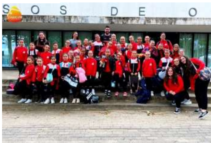
FIGURA 34-ATLETAS DO 2º DIA