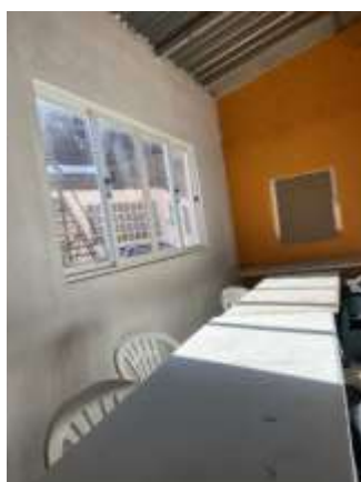
FIGURA 8-SALA DE ESTUDO