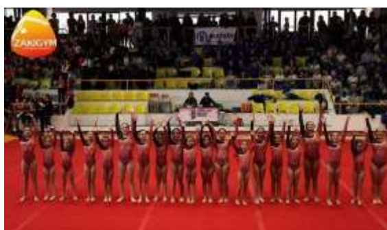
FIGURA 30- CLASSE ZURI