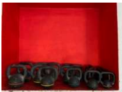
FIGURA 45 - ARRUMAR O MATERIAL