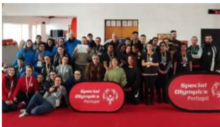
FIGURA 18- COMPETIÇÃO SPECIAL OLYMPICS

Ao longo do estágio, participei em diversas atividades que foram extremamente enriquecedoras. Em particular, tive a oportunidade de acompanhar a APPACDM, o que me proporcionou a chance de trabalhar com pessoas dotadas de carismas únicos e especiais. Estas pessoas se destacam não pelos desafios que enfrentam, mas pela força e determinação que demonstram. Durante o estágio, acompanhei os treinos das ginastas da APPACDM, onde auxiliava na execução de coreografias, explicando os movimentos necessários e ajudando-as a realizá-los corretamente. Além disso, tive a honra de estar ao lado delas durante o Special Olympics Portugal.