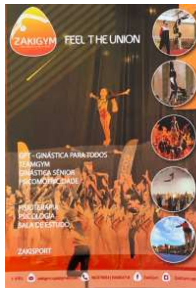
FIGURA 16-FLYER DE FRENTE

Alguns dos métodos que o clube usa para divulgar o seu trabalho é através de flyers