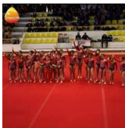
FIGURA 27-CLASSE AKIN