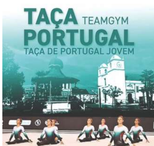
FIGURA 21-CARTAZ DA TAÇA DE PORTUGAL