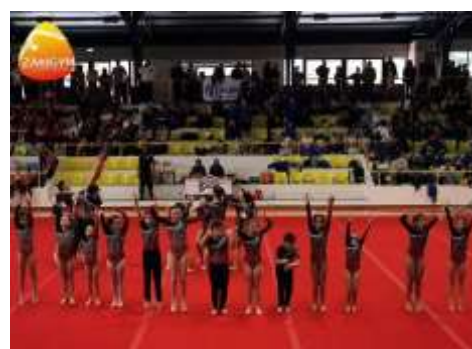
FIGURA 29-CLASSE SHAKA