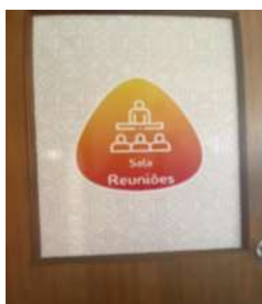
FIGURA 9-SALA DE REUNIÕES