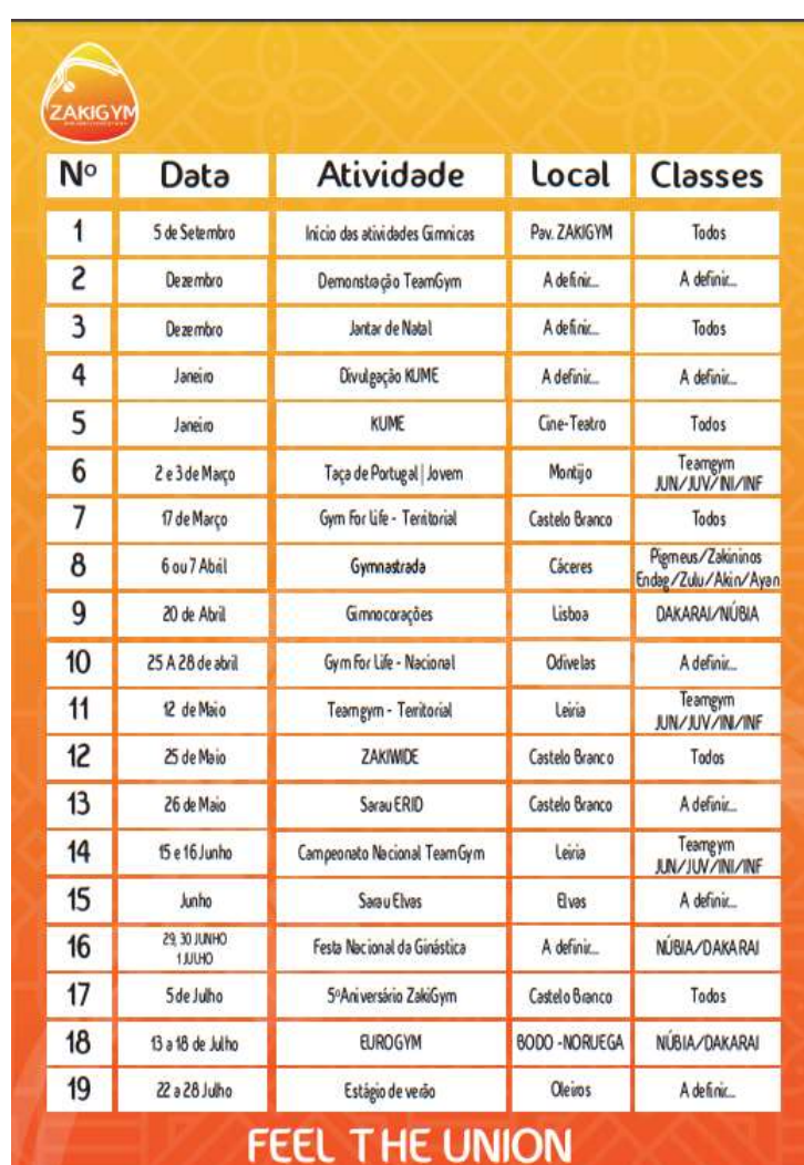
FIGURA 15- ATIVIDADES DA ÉPOCA

Na tabela a seguir, estão enumeradas as competições e demonstrações nas quais tive a oportunidade de marcar presença, destacando minha participação ajudando com os atletas.