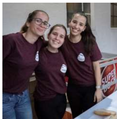
FIGURA 38 -UMA DAS EQUIPAS DA ZAKIWIDE DE COMIDA