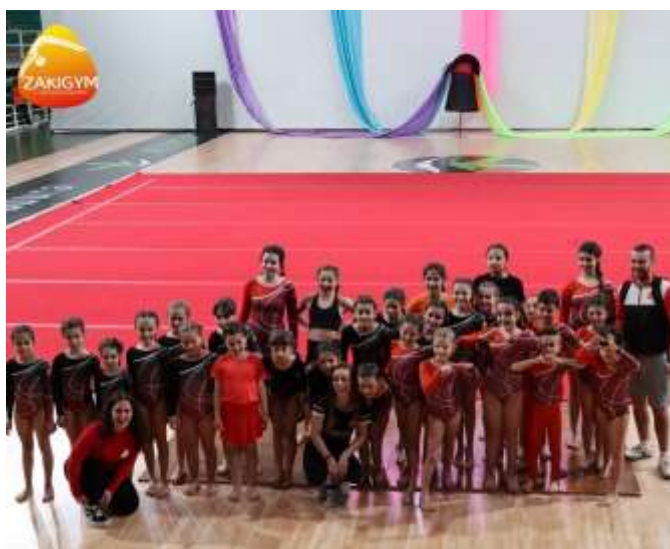
FIGURA 32-DEMONSTRAÇÃO EM CÁCERES

No dia 6 de abril, a ZakiGym esteve presente na 28ª Gimnastrada Extremadura, em Cáceres, para demonstrar o trabalho desenvolvido nas suas aulas. Cada turma apresentou a sua coreografia, e esta ocasião foi especialmente significativa para mim. Pude acompanhar de perto os ginastas das turmas Zulu e Endag, ajudando-os tanto na preparação do vestuário como no aquecimento. Além disso, tive a oportunidade de os ajudar a relaxar, já que estavam bastante nervosos.