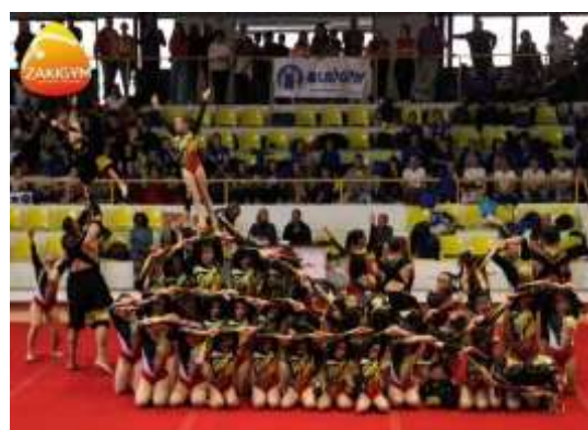
FIGURA 31- CLASSE NUBDAK