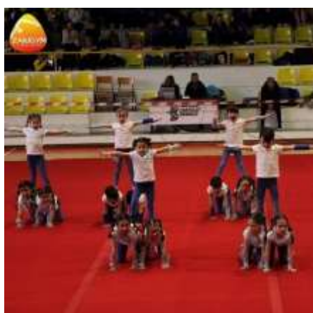
FIGURA 24- CLASSE PIGMEUS