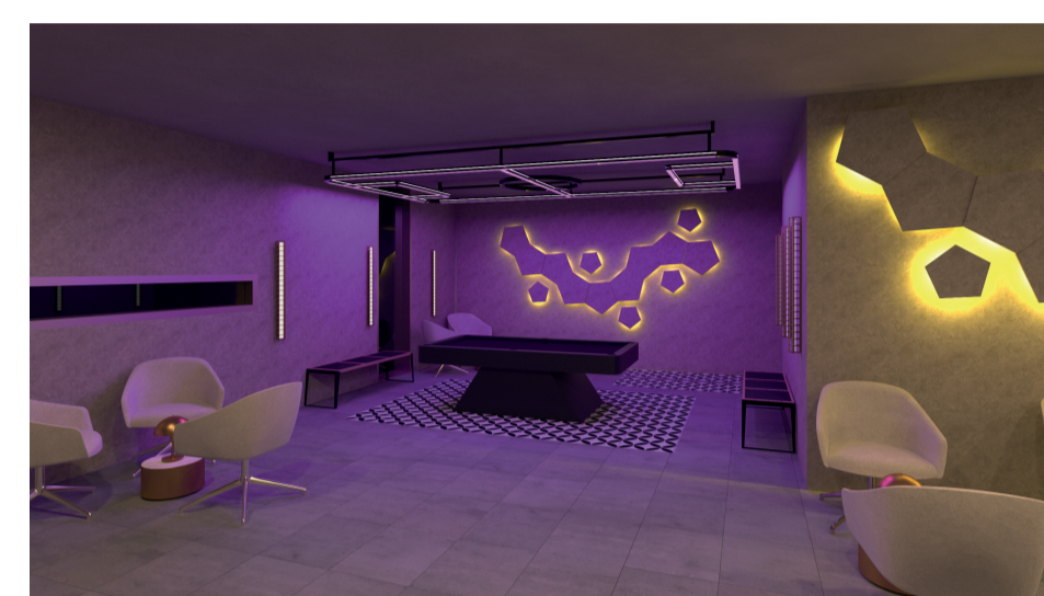
Zona de Jogos