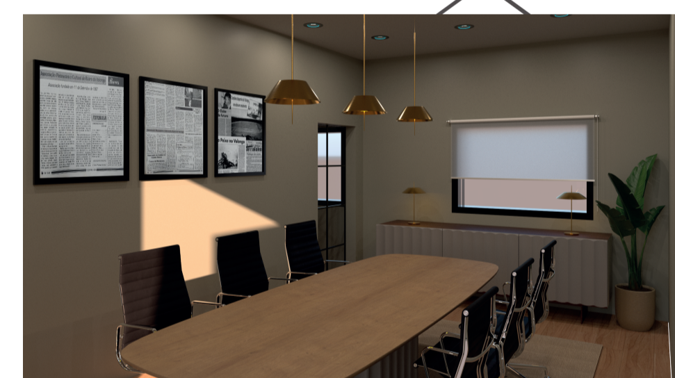
Sala de Reuniões