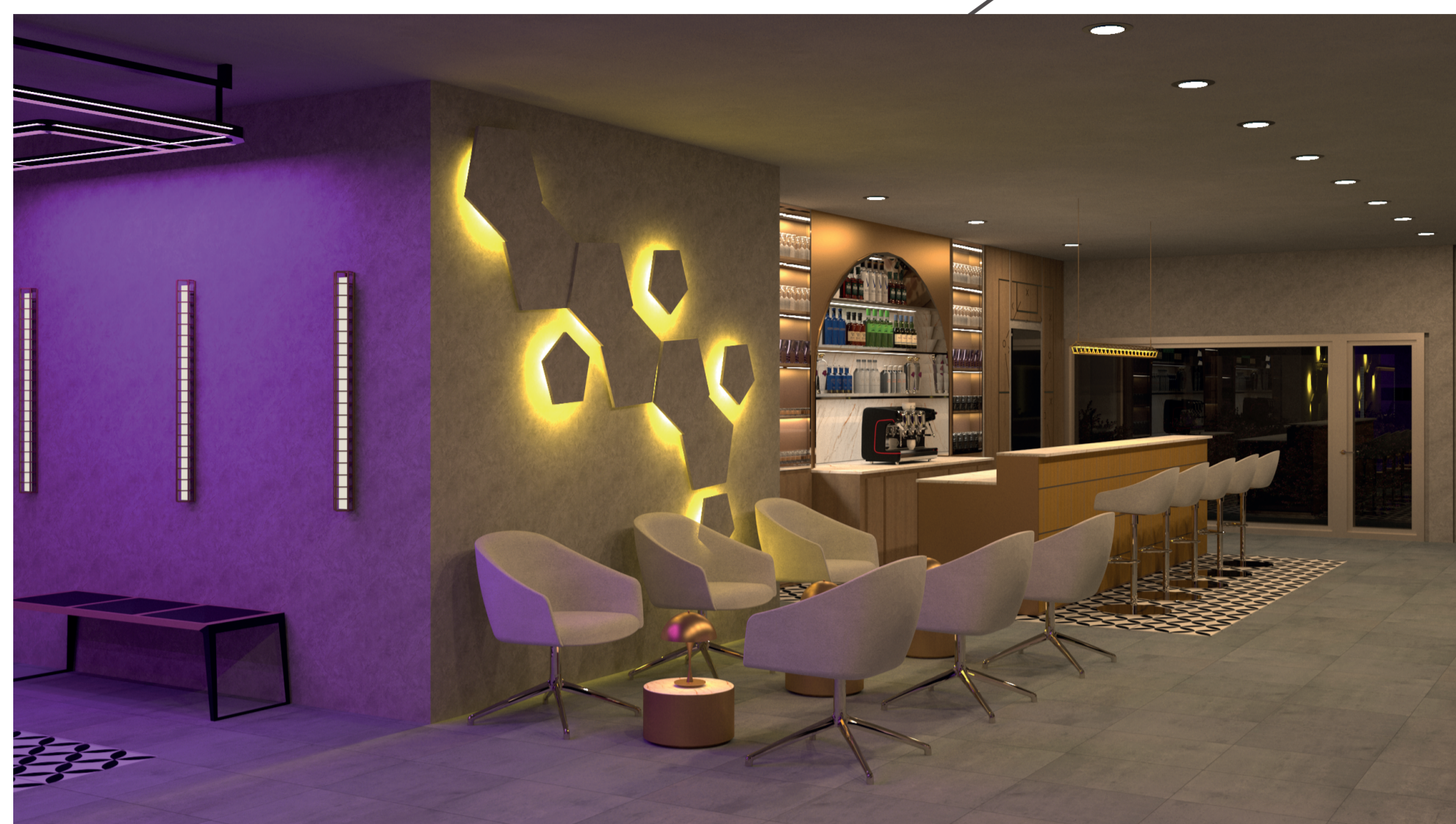
Zona de Consumo

A reestruturação da Associação Recreativa e Cultural do Bairro do Valongo (A.R.C.B.V) visa na criação de um espaço dinâmico, inovador e único no bairro, atendendo às necessidades dos seus moradores, promovendo-se a vivência entre estes. Este projeto contempla a conceção de duas áreas distintas: o bar e a área administrativa do clube. Estas seguem um conceito diferente, sendo o primeiro, o bar, influenciado nas áreas vips dos estádios de futebol, revelando-se um espaço que exala conforto e luxo através dos seus elementos decorativos. O segundo, a zona administrativa, é instigado no conforto das salas de estar de uma habitação unifamiliar, que emana um ambiente tranquilo e acolhedor através dos seus materiais e paleta cromática. Em suma, é um projeto que procura causar uma rutura com o estigma de que este edifício, por estar ligado à A.R.C.B.V, é desprovido de design e inovação.