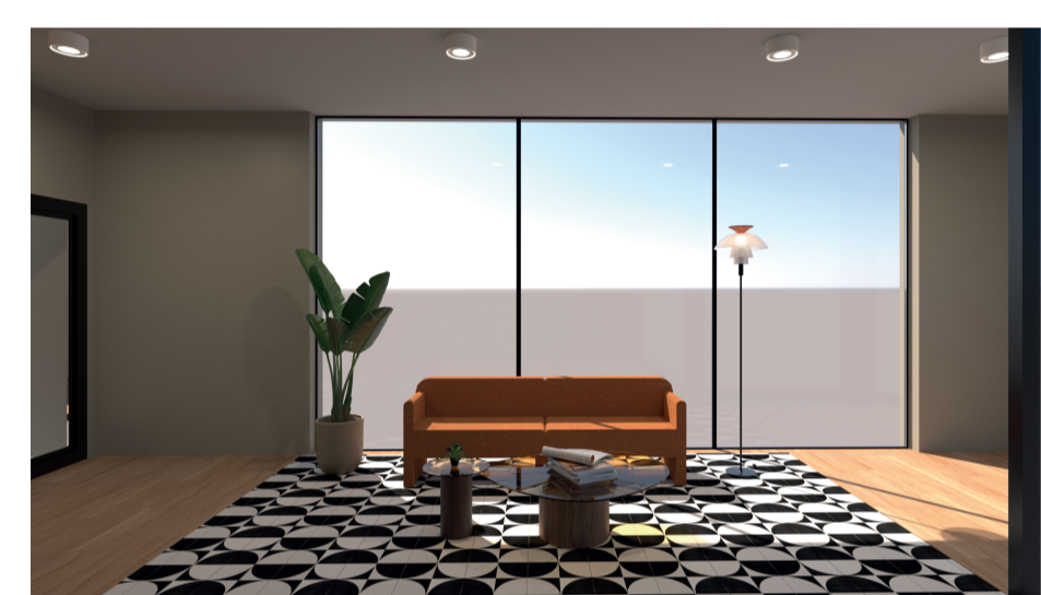
Zona de Estar