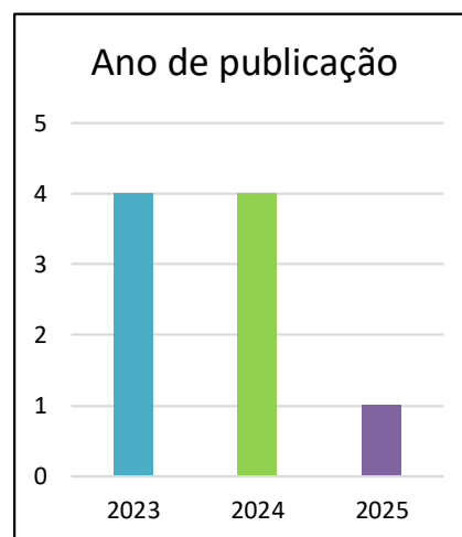
Gráfico 2 – Localização temporal dos artigos