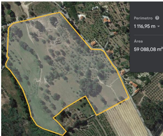
Fig. 3 – Área de pastoreio para ovelhas em produção