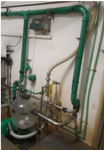
Fig. 7 – Vaso coletor de leite