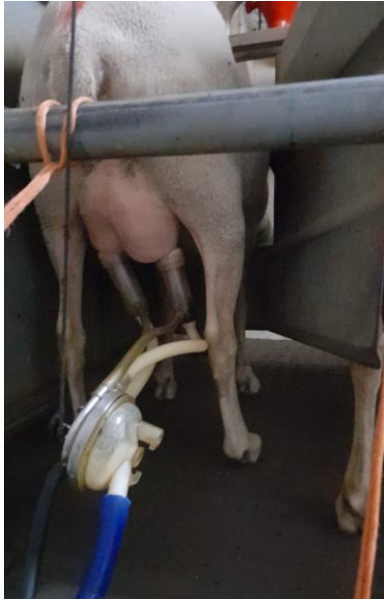
Fig. 5 - Equipamento de ordenha em funcionamento