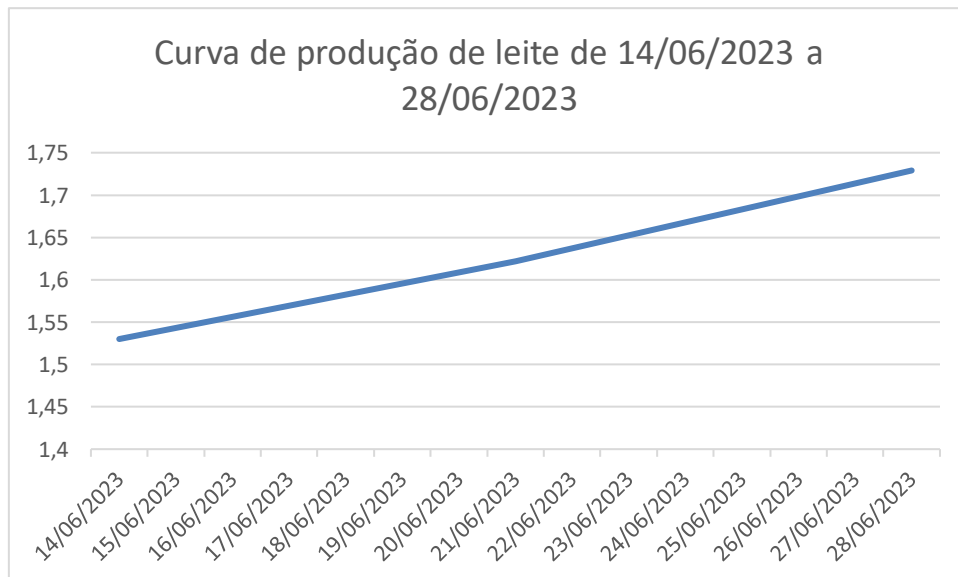
Fig. 13 – Produção de leite de ovelhas múltiparas da raça Lacaune em estudo