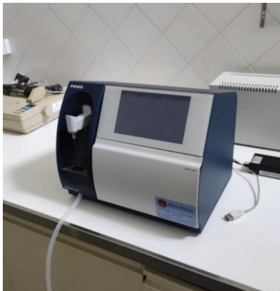
Fig. 10 – MilkoScan™ Mars

À chegada ao laboratório de nutrição animal da ESA-CB, as amostras foram colocadas em banho-maria a uma temperatura de 38°C durante cerca de 30 min. As amostras foram quantificadas individualmente. Antes de serem analisadas no MilkoScan™ Mars (Figura 10) foram corretamente homogeneizadas.