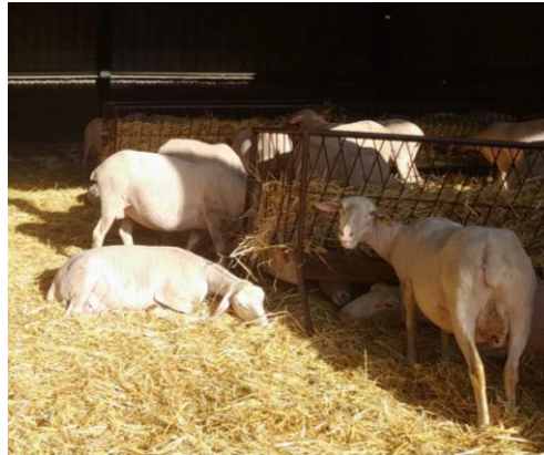
Figura 1 - Ovelhas da raça Lacaune escolhidas para o estudo