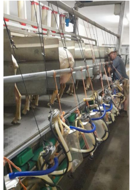
Fig. 6 – Sala de ordenha “SURGE” com 12 pontos