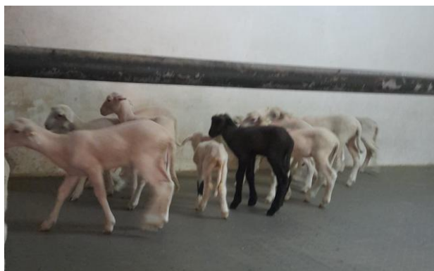
Fig. 9 – Borregos selecionados para o estudo

Os borregos após o nascimento permanecem cerca de 30 dias com a progenitora, passado esse período saem da exploração, pois não é efetuada engorda. Durante o seu período de permanência apenas se alimentam de leite materno. No caso dos futuros reprodutores é feito um desmame tardio por um período escolhido pelo proprietário da exploração, em seguida estes animais são separados em lotes por sexo e é lhes fornecido alimento a descrição (feno e ração) até atingirem os 12 meses de idade altura em que são colocados em reprodução.