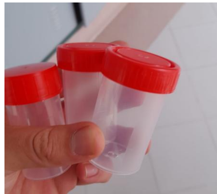
Fig. 11 – Copos de colheita de amostras de leite