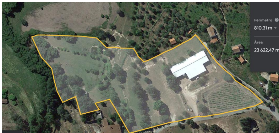
Fig. 2 – Área de pastoreio para ovelhas em produção e instalações

Esta é uma exploração pecuária dedicada á produção de leite de ovinos da raça Lacaune. A exploração está dividida em 2 parcelas uma delas onde se encontram as instalações pecuárias e a sala de ordenha e a outra onde se encontram a campo as ovelhas secas e gestantes.