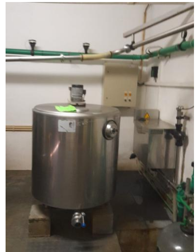
Fig. 8 – Tanque de refrigeração