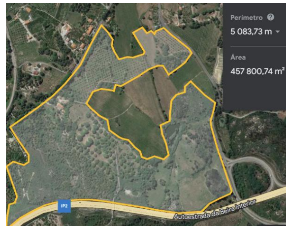
Fig. 4 – Parcela de permanência de ovelhas secas e gestantes