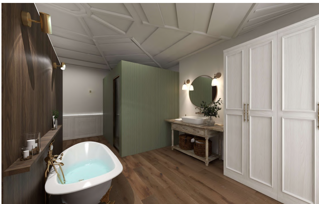
Figura 8 - Simulação 3D das Instalações Sanitárias do quarto de casal e Mobilidade Reduzida do Piso 1

Os restantes quartos são idênticos a este exceto o familiar que em vez de uma cama tem duas, o que permite a junção ou separação para maior privacidade.