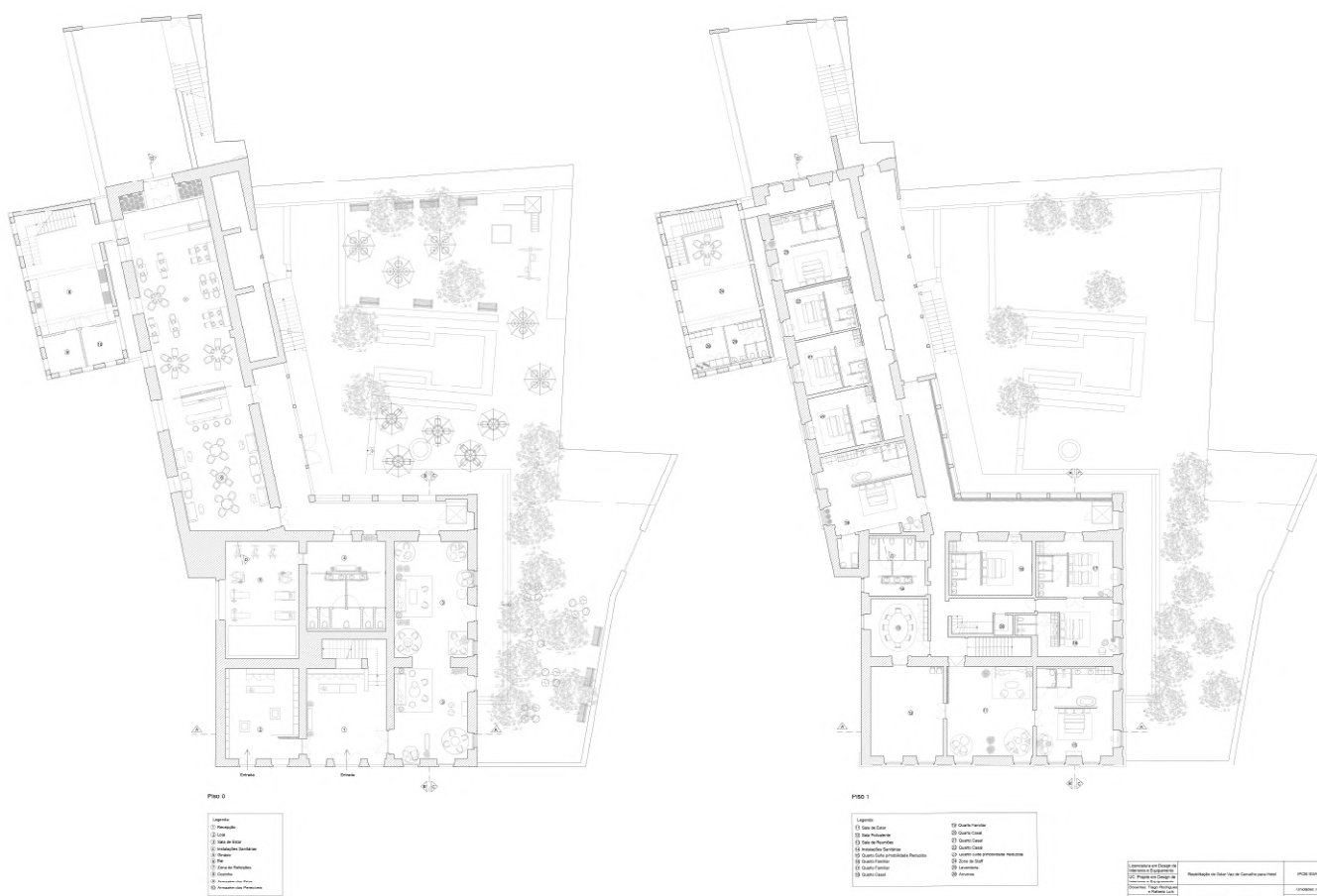
Figura 2 - Plantas de Apresentação, Piso 0 e Piso 1

Assim sendo, o conceito estético escolhido para o projeto vai ao encontro destas características arquitetónicas. Já que se trata de um edifício com características históricas, estas devem ser destacadas, ao mesmo tempo que o espaço deve modernizar-se, para não ficar esquecido no tempo. O principal objetivo é preservar a memória do Solar utilizando os elementos já presentes, reforçando-os, e contrastando-os com mobiliário contemporâneo, gerando assim uma harmonia entre o passado e o presente e tornando o espaço atemporal.