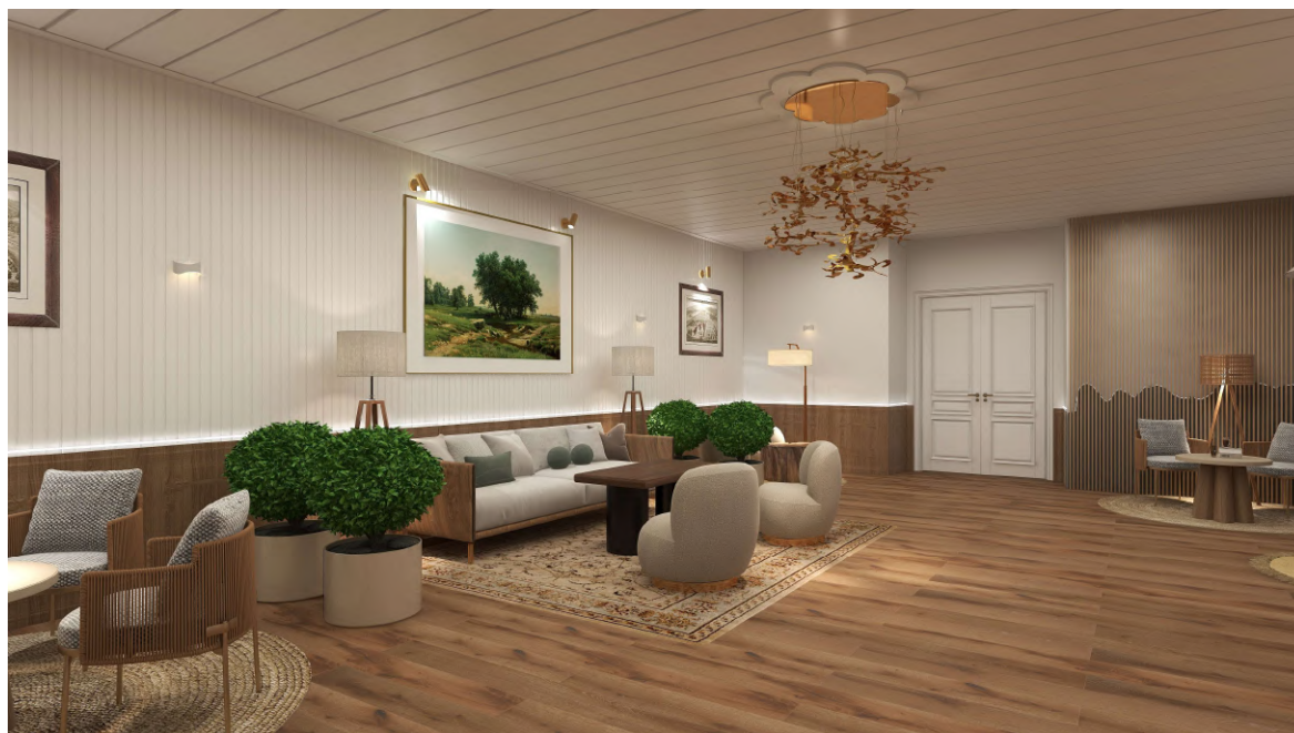
Figura 5 - Simulação 3D da Sala de Estar

Assim, a sala de estar é um espaço de descanso e apreciação de obras de arte pelo publico do hotel. No entanto, em época baixa este espaço pode ser aberto ao público por um valor simbólico para a apreciação destas obras, assim como desfrutar de uma refeição no hotel. Aqui é transmitida a sofisticação através da escolha do mobiliário e das cores usadas.