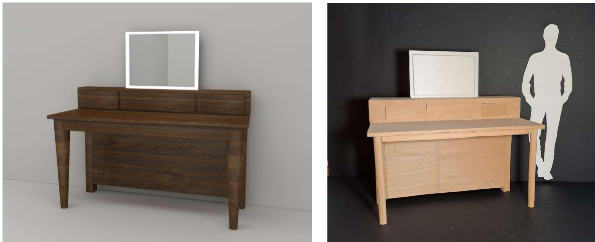
Figura 9 - Simulação 3D do Toucador

Para os quartos foi projetado um equipamento, um toucador, que tem como função auxiliar os hóspedes, assim como em caso de existirem trabalhadores digitais, poderem usar este de auxílio para o trabalho. Tornando-se assim um espaço funcional e estético.