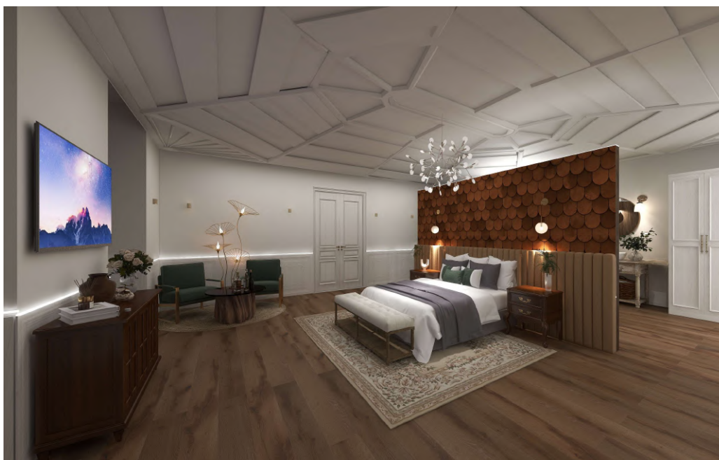
Figura 7 - Simulação 3D do Quarto de Mobilidade Reduzida do Piso 1

Já no piso superior encontram-se os quartos, todos com a mesma disposição, a cama centralizada no espaço. Referindo o quarto pormenorizado, é possível definir duas zonas, a zona de descanso e a zona da instalação sanitária, que são separadas por uma parede com 2,50 m de altura, para não encostar no teto original. No lado da instalação sanitária encontra-se uma divisão com a sanita, com as medidas adequadas para a mobilidade reduzida, um duche, uma banheira, com estética mais antiga, um lavabo e um guarda-roupa, e na parte de descanso encontra-se a cama, uma zona de estar e o tocador.