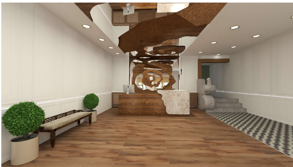
Figura 3 - Simulação 3D da Recepção

A paleta cromática foi escolhida para transmitir calma, tranquilidade e sofisticação, através do uso de cores claras, como o branco e tons amadeirados no pavimento equipamentos e na instalação colocada no teto falso. Esta instalação simboliza a topografia do Fundão e, por isso, possui um relevo com diferentes alturas. Para a sua construção foram usados materiais mais escuros para a destacá-la espaço.