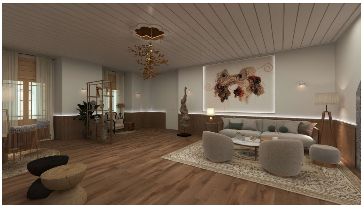
Figura 4 - Simulação 3D da Sala de Estar

Falando agora da Sala de Estar, este espaço desenvolve-se em torno de um corredor central, pensando em garantir a acessibilidade a pessoas de mobilidade reduzida. Para trazer dinamismo quebrar um pouco a monotonia nos tetos antigos, foi escolhido um mobiliário variado, incluindo três tipos de cadeiras, quatro tipos de mesas, assim como ocorre com outros equipamentos.