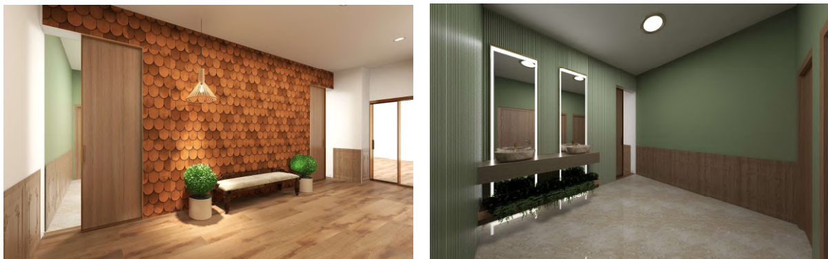
Figura 6 - Simulação 3D da Sala da I.S. do Piso 0

Neste espaço não existe iluminação natural, por isso, foi necessário integrar iluminação artificial disposta no teto falso de 30 cm. Sendo usados spots e sensores de movimento para evitar os interruptores.