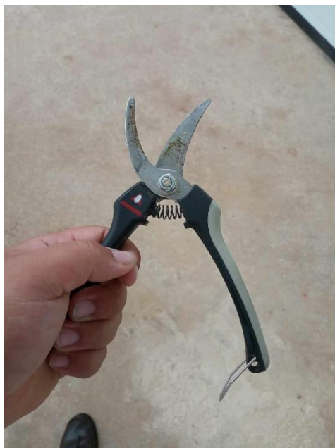
Figura 8- tesoura manual

No local de estágio efetuou-se a monda dos frutos manualmente, já no final do período do estágio na empresa “Terraço do Girassol”, tendo sido necessário para esta tarefa a colaboração de 12 funcionários, todos eles equipados com uma tesoura manual (Figura 8) de modo a cortar o pedúnculo da maçã que estivesse deformada ou a mais na árvore (Figuras 9 e 10). A monda na cultivar Gala situada na “Quinta do Casal”, parcela que tem 1.80 ha, demorou um total de 24 horas de trabalho.