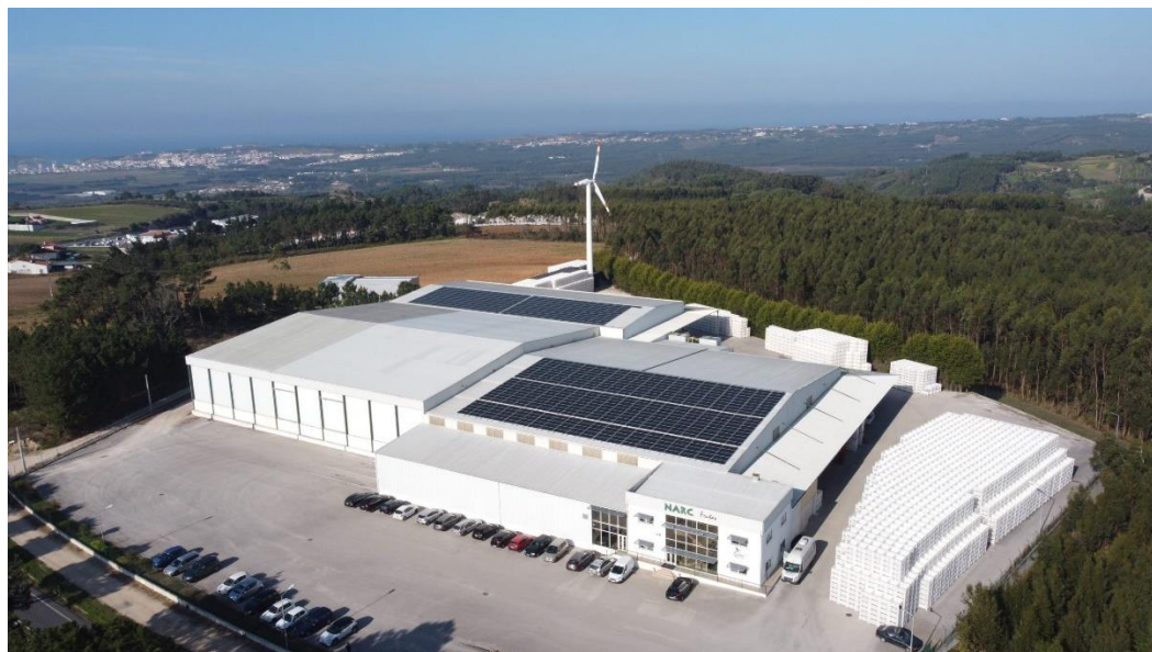
Figura 1 - Vista geral da OP “Narc Frutas” (NarcFrutas, 2024).