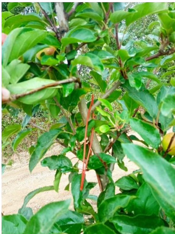
Figura 12 – Difusor de feromonas

4 funcionários em toda a área de pomar da empresa durante 3 dias de trabalho, num total de 24 horas.