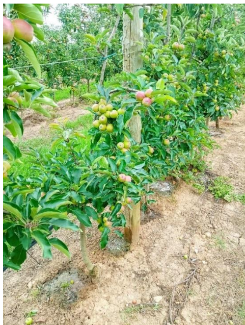
Figura 9 - Árvores antes de monda