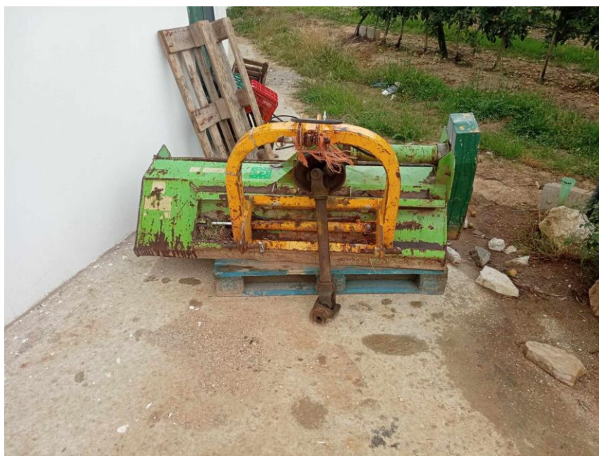
Figura 7 – capinados de infestantes na entrelinha

Na entrelinha, como o pomar está com enrelvamento controlaram-se as infestantes através da utilização de um capinador acoplado ao trator (Figura 7), para a realização desta tarefa em toda a área da empresa, 12,5 ha, foram necessários três dias de trabalho todos eles com uma duração de 9 horas, um total de 27 horas de trabalho.