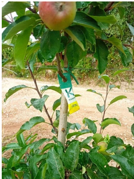
Figura 11 - Saqueta de insetos auxiliares (foto original).

Durante o período de estágio, realizou-se a distribuição de insetos auxiliares predadores ( Neoseiulus californicus ) para o combate ao arañiço-vermelho ( Panonychus ulmi ), que vinham dentro de uma saqueta (Figura 11) que era colocada de sete em sete árvores na fila.