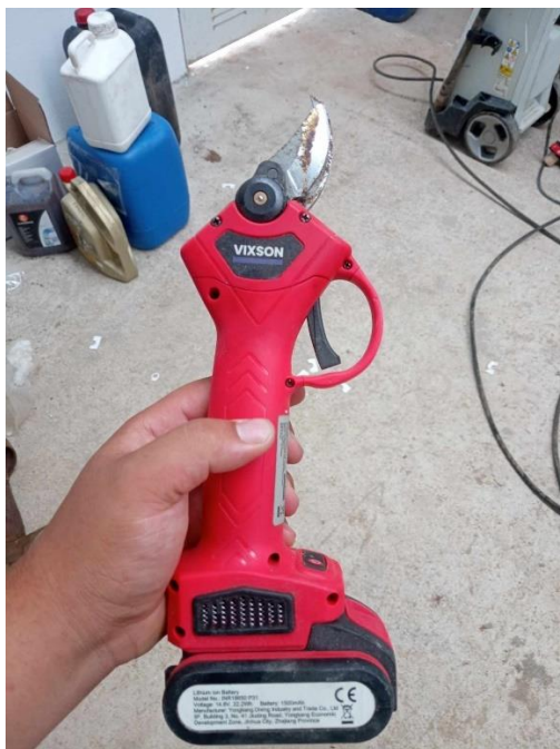
Figura 2 - Tesoura de poda elétrica (foto original).

Realizei esta tarefa no pomar de cultivar Fuji na “Quinta do Casal”, com 1,20 ha com 4 colaboradores, demorando esta tarefa um total de 24 horas de trabalho.