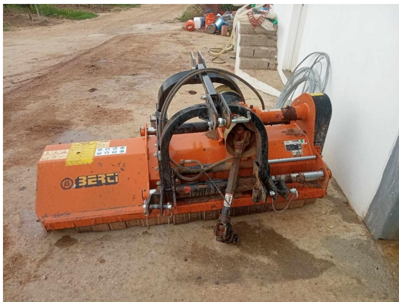
Figura 3 - Destroçador de lenha de poda (foto original)

Toda a lenha cortada das árvores foi destroçada para não dificultar outras tarefas, permitindo efetuar outras intervenções no pomar. Esta tarefa foi realizada com um trator e um destroçador descentrável (Figura 3) acoplado à traseira do trator, para conseguir destroçar a lenha o mais perto possível da linha.