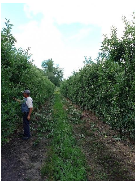
Figura 4 – Funcionário a realizar a poda em verde (foto original).

Na empresa, a poda verde (Figura 4) foi realizada durante o mês de junho. Esta teve como objetivo o arejamento da copa da árvore e uma maior entrada de sol no interior da copa de modo a favorecer a coloração dos frutos.