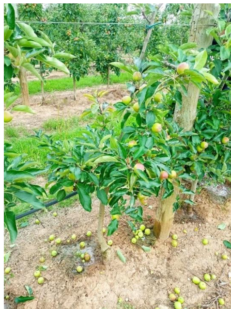
Figura 10 - Árvore depois de monda