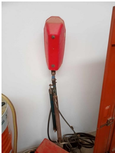
Figura 5 – Bico de pulverização com herbicida

O controlo de infestantes na empresa “Terraço do Girassol”, na linha foi efetuado através da aplicação de herbicida sistémico, que é aplicado com o pulverizador acoplado ao trator e um bico de pulverizador na direção do solo na linha (Figura 5).