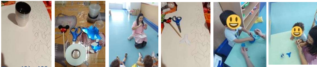
Figura 131 a 136

Depois de mostrar o vídeo com os sons do mar, comecei por realizar a minha atividade das