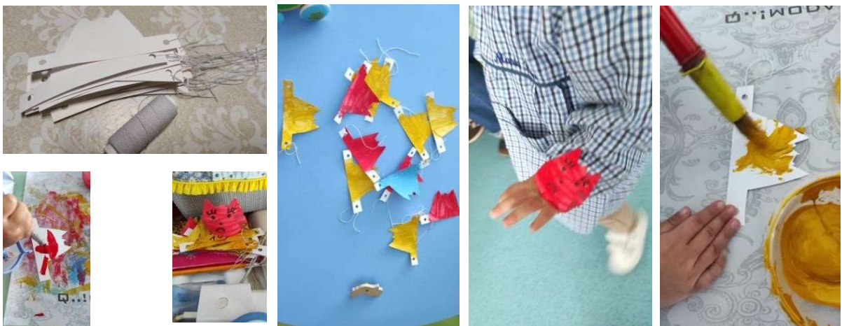
Figuras 40 a 45

As pulseiras foram feitas para cada criança se expressar como se sentia e ver as cores que elas escolhiam e depois perceber porque é que gostavam daquela cor. Cada criança levou para casa a sua pulseira, pintada de acordo com a cor da emoção/sentimento que expressou.