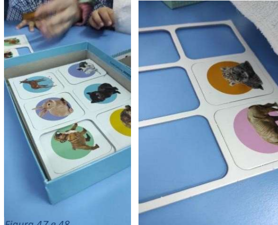
Figura 47 e 48

Na sala onde fiz o estágio, Depois de almoço fazemos sempre o dormitório e ajudo a educadora e a auxiliar a deitar as crianças nas