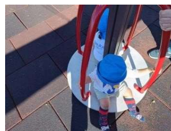
Figura 129 e 130

Sumário 17/06/2024: Canção: “Bom Dia e o “Pão”.