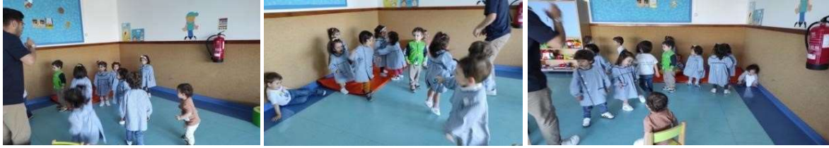
Figura 88 a 90