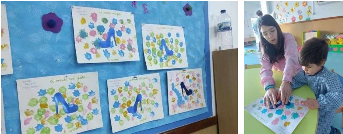
Figura 85 e 86

Sumário 29/04/2024: Canção: “Bom Dia” e o “Pão”.