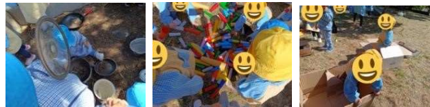
Figura 113 a 115

Neste dia, duas turmas do infantário e uma do jardim de infância do edifício superior fizeram diferentes atividades com as crianças em salas diferentes. Neste dia da parte manhã tinham as caixas de frutas e caixas de cartão para fingir que era uma carruagem do comboio. Numa outra atividade tinham uns tubinhos, para os quais sopravam simulando o apito do comboio, outros fingiam que eram binóculos. Numa outra atividade, havia