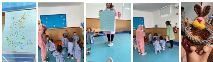
Figura 65 a 69

No final da tarde, perguntei aos pais das crianças se podia dar-lhes um doce de massa pão, com a forma de uma cenoura em miniatura.