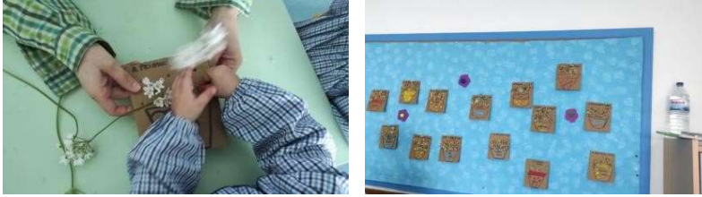
Figura 71 e 72