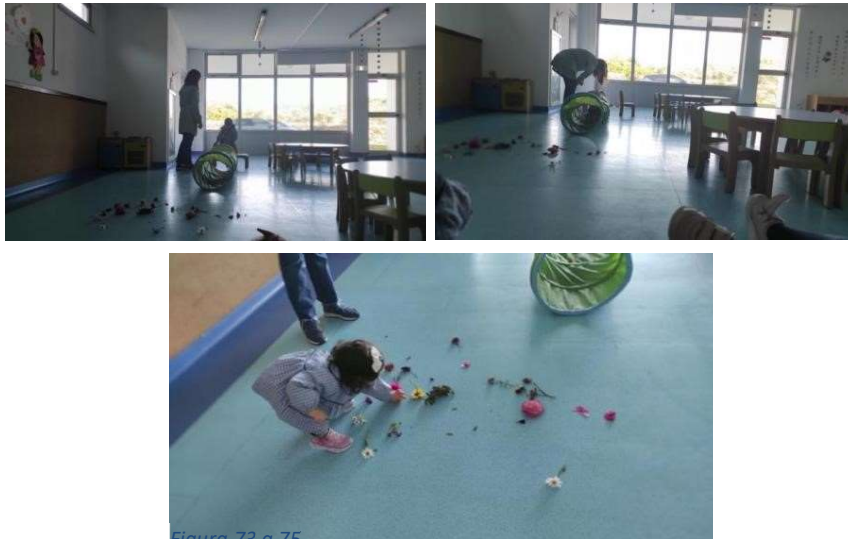
Figura 73 a 75