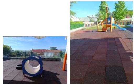
Figura 95 e 96

Durante a tarde, fomos ao parque do infantário, com as crianças.