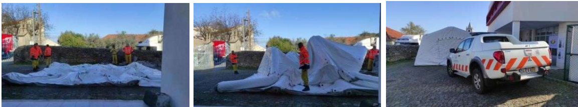
Figura 55 a 57

Sumário, 01/03/2024: Simulacro de Incêndio