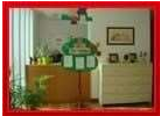
O Figura 2

O êxito do dispensário deve-se ao bom conhecimento que os seus dirigentes tinham do meio em que este se inseria. A creche era destinada às crianças cujas mães trabalhavam fora de casa.