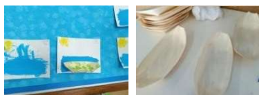
Figura 123 e 125