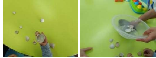
Figura 117 e 118

Sumário 28/05/2024: Canção: “Bom Dia” e o “Pão”.