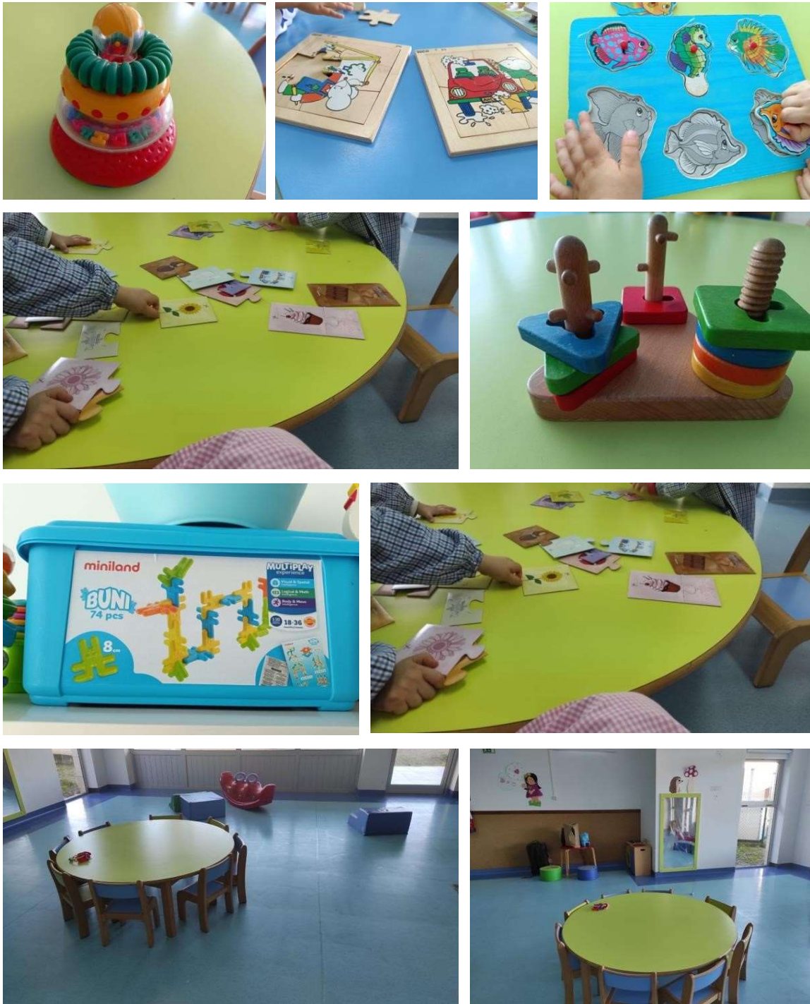
Figura 10 a 18