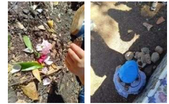
Figura 92 a 94

Exploração de razões matemáticas / da natureza Visita a uma exposição