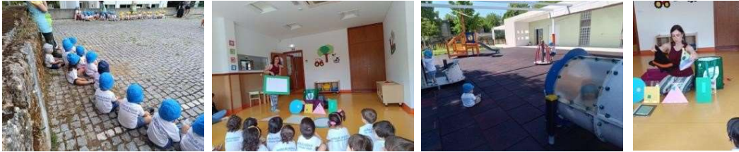
Figura 137 a 140

Sumário 27/06/2024: Canção: “Bom Dia” e o “Pão”.