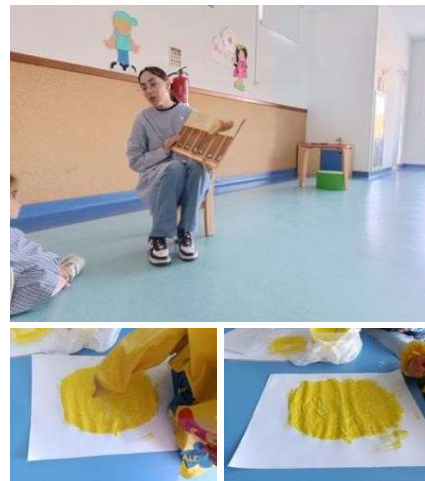
Figura 104 a 106

Com esta atividade, as crianças desenvolveram a psicomotricidade manual, porque estão a aprender a fazer desenhos com a Digitinta, uma tinta que só tem produtos alimentares, de forma a não correrem riscos, uma vez que podem levar as mãos á boca.