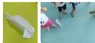
Figura 127 e 128