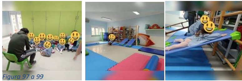
Figura 97 a 99

Sumário, 14/05/2024: Canção “Bom Dia”, Canção “O Pão”.