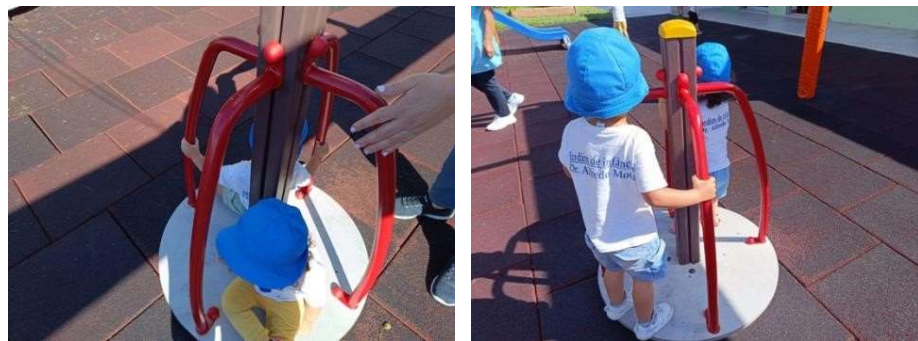
Figura 120 e 121

Neste dia fomos ao parque e da parte da manhã ajudei a educadora a separar os trabalhos pelo nome de cada criança para depois a educadora arrumar os trabalhos dentro das capas de cada criança.