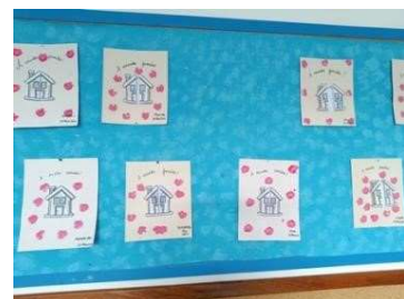
Figura 101 Aula