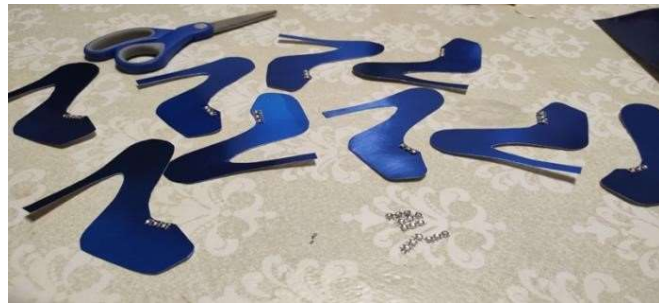
Figura 83 e 84