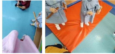
Figura 102 e 103

Com esta atividade das clavas, as crianças desenvolvem os 5 sentidos e a psicomotricidade, há um desenvolvimento cognitivo em que as crianças estão a tentar conseguir apanhar o ritmo de cada música.