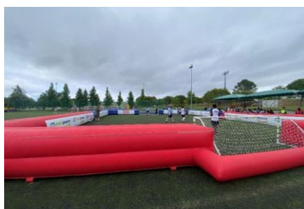
Figura 2 Torneio de Futebol de Rua