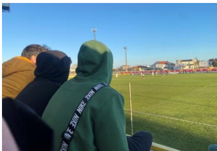
Figura 4 Atividade assistir jogo da seleção distrital de Castelo Branco