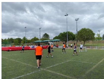
Figura 3 Atividade secundária designada Futsal do Torneio de Futebol de Rua