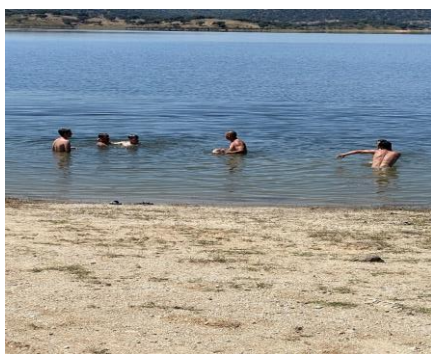
Figura 1 Ida á barragem de Idanha