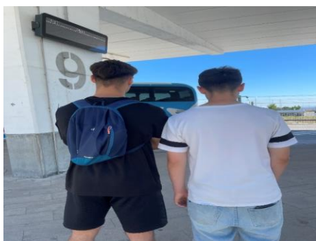
Figura 5 Ajuda a levar os jovens até á rodoviária