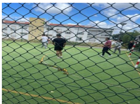
Figura 6 Jogos de futebol no campo da associação do bairro do cansado