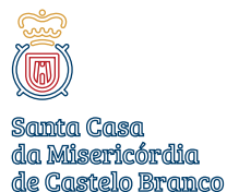
Utilização de outline